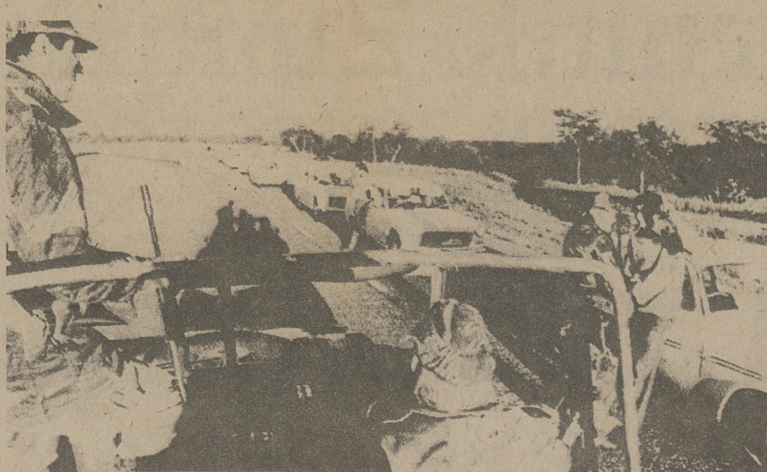
SALISBURY, RODEZJA. — Podróżujący odpoczywają wzdłuż głównej autostrady łączącej Rodezję z Południową Afryką. Obok czuwają żołnierze Armii Rodezyjskiej w następstwie zamordowania trzech motocyklistów przez murzyńskich partyzantów.

Paryż (UPI) — Państwa naftowe należące do OPEC zadeklarowały gotowość wpłacenia 400 milionów dolarów na miliardowy Fundusz Rolniczy i Żywnościowy państw ubogich, pod warunkiem jednak, że państwa uprzemysłowione wpłacą od siebie 600 milionów dolarów.