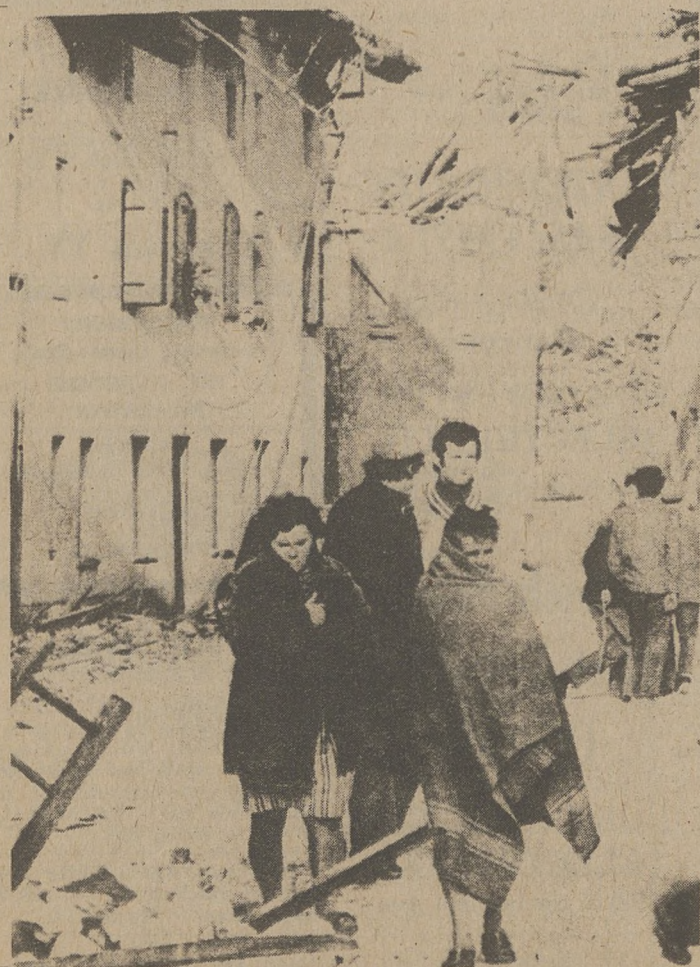
CASASOLA, WŁOCHY. — Kobiety włoskie stoją wśród gruzów swoich domów po trzęsieniu ziemi w północno-wschodniej części Włoch, w czasie którego zginęło przeszło tysiąc osób.

Blizszych informacji o nośności wszystkich imprez związanych z 200-leciem USA można zasięgnąć, dzwoniąc na nr. tel. 431-1776 (Chicago Bicentennial Committee).