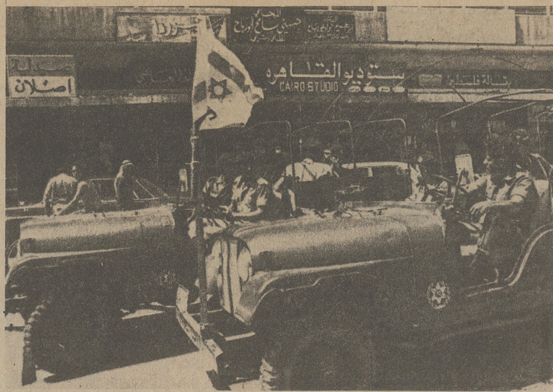
NABLUS, JORDANIA. — Żołnierze izraelscy patrolują dzielnicę miasta w czwartym dniu po ogłoszeniu godziny policyjnej, ażeby zapobiec demonstracjom przeciw okupacji izraelskiej w 20-tą rocznicę niepodległości Izraela.

Podobny wypadek zdarzył się przed dwoma miesiącami, gdy strażnik zauważył zmianę kaucji z $18,000 na $6,000. Więzień powiedział, że żona wpięła kaucję zastępcy szeryfa. Żona, jednak, którą przesłuchiwali detektywi powiedziała, że wręczyła pieniądze adwokatowi. W trzecim wypadku więzień zabrał papiery do umywalni i zmienił kaucję z $17,000 na $7,000.