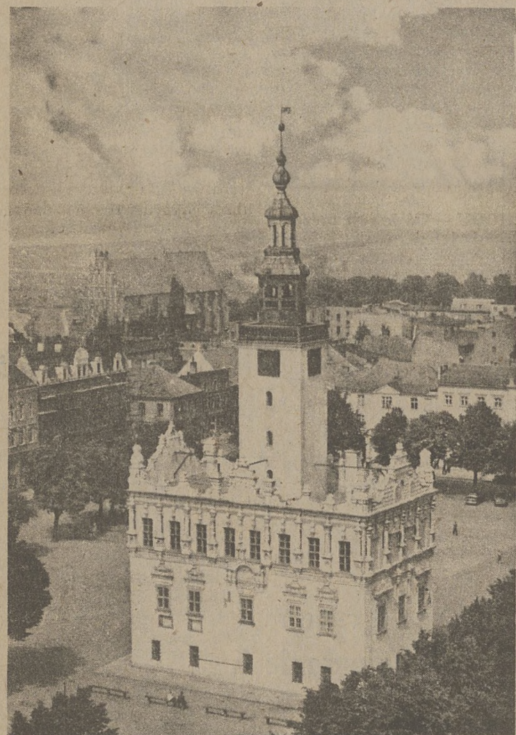
Ratusz chełmiński z drugiej połowy XVI wieku zalicza się do najpiękniejszych budowli renesansowych w Polsce. Pierwotnie była to budowla gotycka i przy odnawianiu obiektu odsłonięto fragmenty starszych murów. Czworoboczną wieżę z galerijką w późniejszych czasach nakryto barokowym hełmem. Wbrew temu co widać na zdjęciu, ratusz ma tylko dwie kondygnacje. Trzecią kondygnację udają ślepe okna w pięknej, typowo polskiej attyce renesansowej. Rynek chełmiński z uznanym za zabytek brukiem z "kocich łbów" — otrzyma częściowo inną nawierzchnię. Po długich targach władze konserwatorskie zgodziły się na częściowe przykrycie rynku gładzonymi płytami granitowymi na podłożu betonowym.