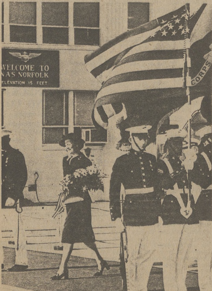
NORFOLK, VA. — Królowa Danii Margareta II trzyma w ręku bukiet kwiatów który otrzymała po przybyciu do U.S. Królowa i jej mąż, książę Henrik, zwiedzają Amerykę.