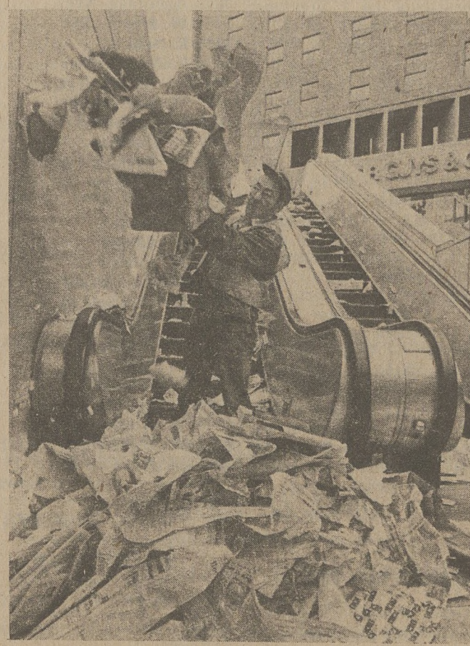
SAN FRANCISCO — Zamiatacz ulic w San Francisco powrócili do pracy po 38-dniowym strajku obejmującym rzemieślników miejskich. Jednak porozumienie które zakończyło strajk jest kwestionowane na tle jego legalności.