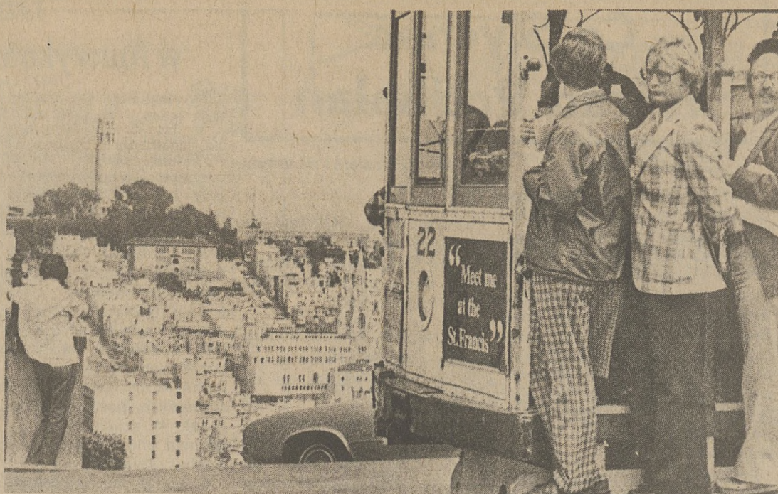
SAN FRANCISCO — Ku ucieście zarówno mieszkańców jak i turystów słynne tramwaje w San Francisco rozpoczęły ponownie kursować po 39 dniowym strajku pracowników miejskich.

Pogrzebem zajmuje się: Zakład Pogrzebowy B. F. Malec i Synowie, Telefon 774-4100.