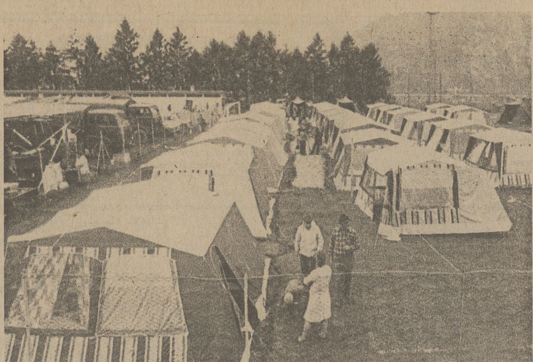
VENZONE, WŁOCHY — Widok ogólny miasta namiotów rozbitych w pobliżu Venzone dla osób ocalałych w czasie trzęsienia ziemi, które spowodowało śmierć przeszło 1,000 osób.