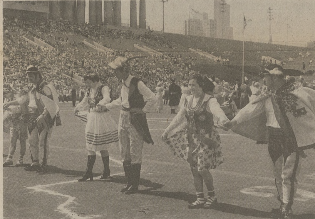
UKŁON PO WYSTĘPIE — Różnorodne polskie ludowe stroje stwarzały specjalny efekt w tradycyjnym "Polonezie".