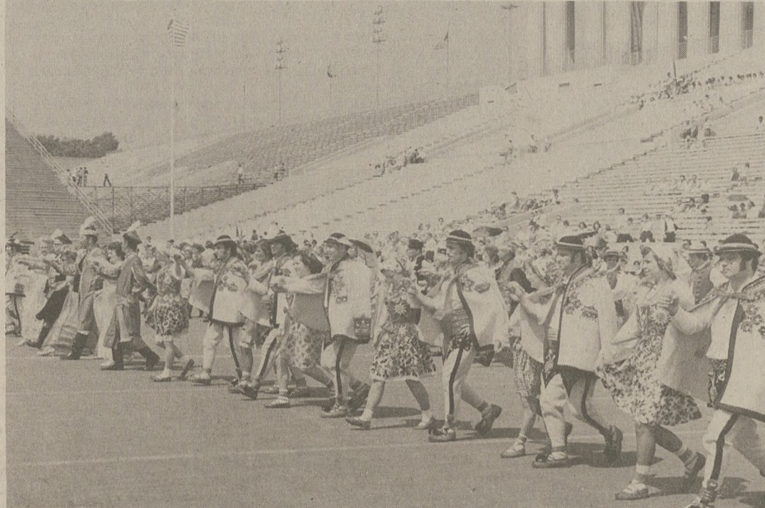
Grupa Podhalań rozpoczyna "Poloneza".