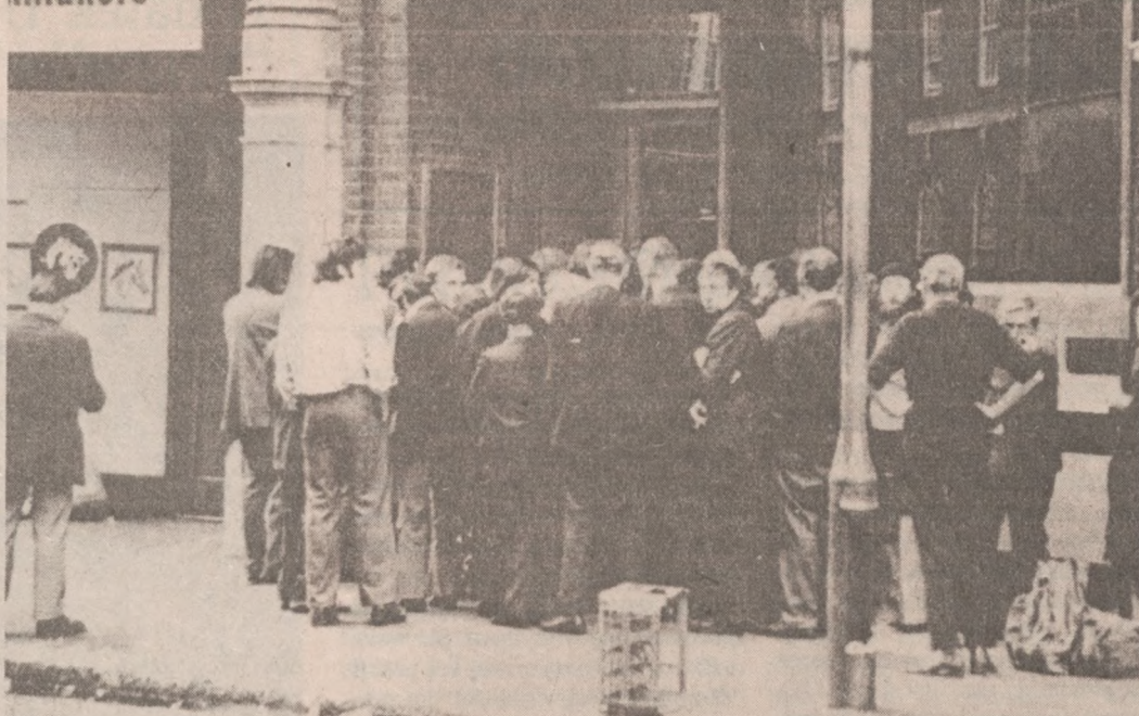
LONDYN — Bezrobotni czekają w kolejce przed biurem Departamentu Zatrudnienia w nadziei otrzymania chociaż chwilowej pracy. Wielu śpi przez noc na chodniku ażeby zapewnić sobie miejsce na czele kolejki. W obecnej chwili w Wielkiej Brytanii jest przeszło 1.5 miliona bezrobotnych.