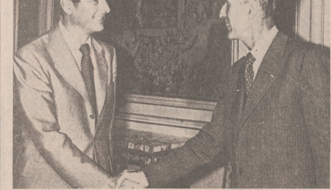
PARYŻ — Premier Jacques Chirac (po lewej) żegna się z prezydentem Valérym Giscard d'Estaingiem w czasie zebraania Rady Ministrów w Paryżu. Zwolnienie Chiraca, podawane oficjalnie jako rezygnacja, było spodziewane od kilku dni.

Przedstawiciel firmy budowlanej Guardian Money Management Corp. of Chicago, powiadomił we wtorek o planach budowy Fairmont Hotel, na Wacker, na południe od ul. Michigan w Illinois Center. Koszt budowy wyniesie $50 milionów. Finansowanie nie jest jeszcze kompletne, nie zakupiono także gruntu a przedstawiciel Metropolitan Structures, współwłaściciela Illinois Center wraz z IC Industries, powiedział, że dotychczas nie zawarto porozumienia. Urzędnik Metropolitan mówi, że nowi przedsiębiorcy nie są właścicielami gruntu, na którym zamierzają budować luksusowy hotel, więc nawet gdyby przybyli dziś lub jutro z pieniędzmi, nie oznaczaloby to bynajmniej, że mogą rozpocząć prace budowlane. Przedstawiciel Fairmont Corp. mówi, że oznajmienie o budowie zakrawa na strategię, w celu uprzedzenia Hyatt Corp. która poprzednio podała do wiadomości o zamiarze rozbudowy Hyatt Regency Chicago, w Illinois Center. Kompania ubez-