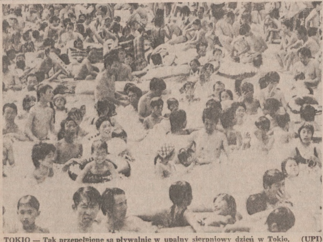
TOKIO — Tak przepełnione są pływalnie w upalny sierpniowy dzień w Tokio.

Pamiętaj, że wobec zmuszenia narodu polskiego do milczenia, "Dz. Związkowy" jest jego wolnym głosem.