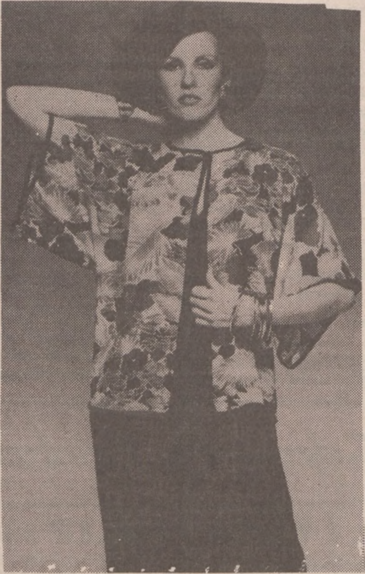
NARZUTKA Z SZYFONU, odpowiednia do każdej popołudniowej lub wieczorowej sukienki.