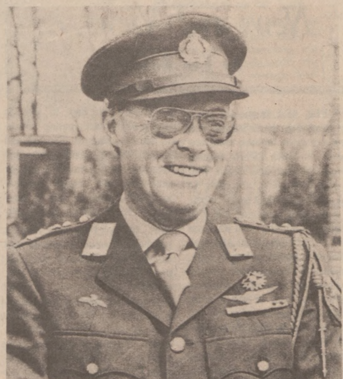
ZDJĘCIE przedstawia księcia Bernharda, który ostatnio zgłosił rezygnację z funkcji państwowych jakie pełnił oraz z urzędu Generalnego Inspektora Armii Holenderskiej.