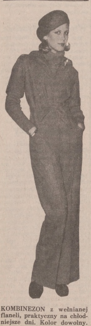
KOMBINEZON z wełnianej flaneli, praktyczny na chłodniejsze dni. Kolor dowolny.