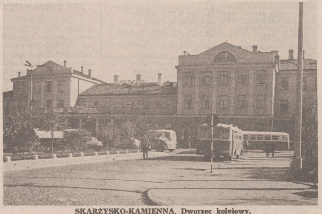
SKARŻYSKO-KAMIENNA. Dworzec kolejowy.

Tse-tunga sowiecka agencja prasowa Tass podała bez jakichkolwiek komentarzy. Obserwatorzy polityczni przypominają, że w dniu 28 kwietnia b.r. partyjna "Prawda" wystąpiła z wezwaniem do Chińczyków o podjęcie rokowań przy stole konferencyjnym i rozważenie propozycji sowieckich, dotyczących normalizacji stosunków na pograniczu ZSRR-Chiny. Dyplomaci podkreślają, że Moskwa nie jeden raz wyciągała "gałkę oliwną" w kierunku młodych przywódców chińskich, a w kierunku Hua Kuo-fenga w szczególności. Niewątpliwie Kreml zajmie chwilowo pozycję wycoekującą i stanowisko obserwatora, ale przywódcą sowieckim zależy na uregulowaniu stosunków z Chinami, co pozwoli nie tylko zmniejszyć ogromne garnizony sowieckie na pograniczu chińskim, ale też przyniesie korzyści gospodarcze i wzmocni blok komunistyczny, któremu przewodzi Moskwa. Do tej pory chińskie środki masowego przekazu nie podały żadnych informacji na temat pogrzebu zmarłego przywódcy.