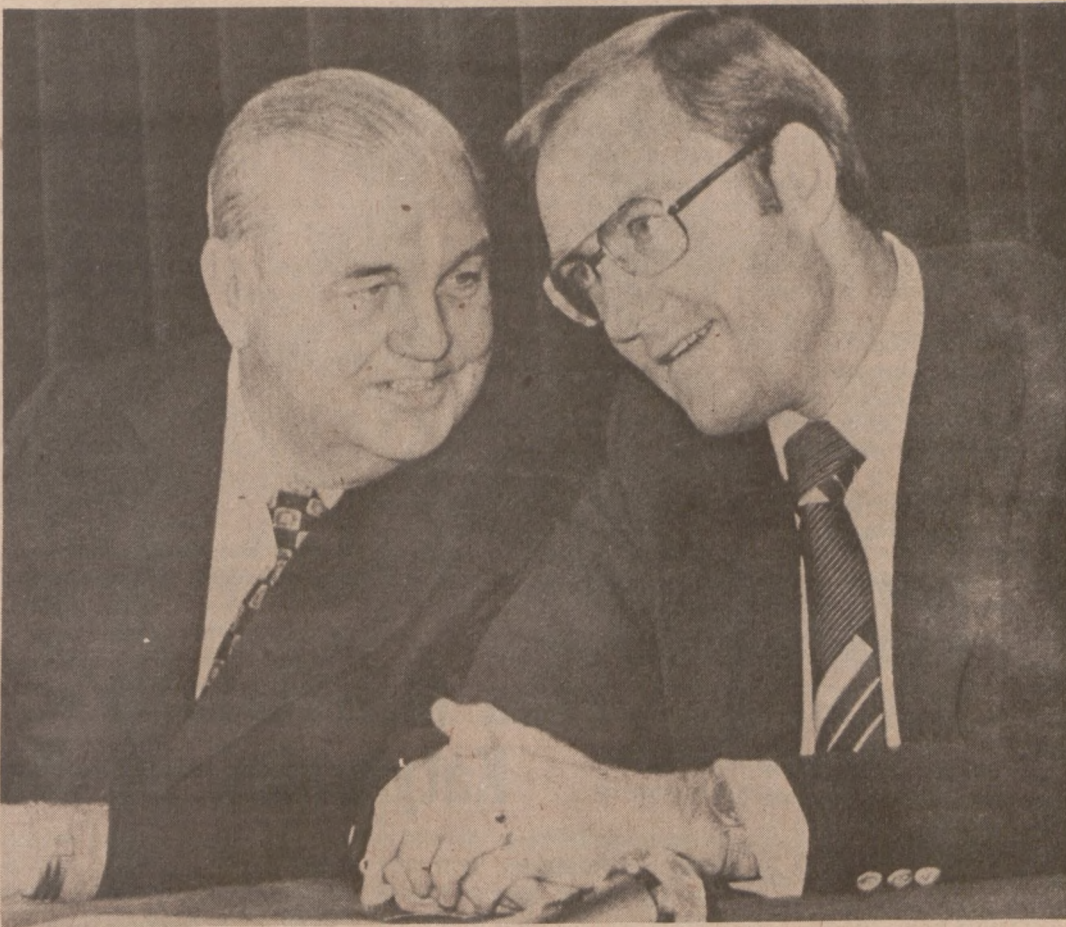
SPRINGFIELD, ILL. — Dwaj kandydaci na gubernatora stanu, Demokrater Michael Howlett (po lewej) i republikański kandydat James Thompson, wymieniają komentarze przed zebraniem ze Stanowym Związkiem Prasowym.