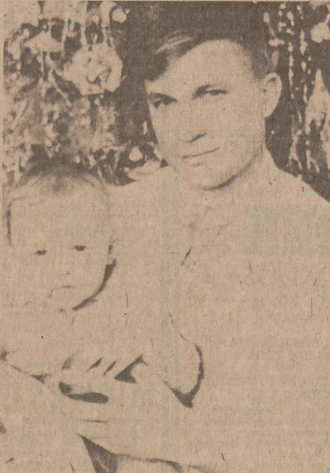
MOSKWA. — Zdjęcie opublikowane przez władze sowieckie przedstawia porucznika Lotnictwa Wiktora Bielenko ze swoim synem w czasie uroczystości noworocznej. Bielenko wyładował samolotem typu MiG-25 w Japonii i poprosił o azyl w Stanach Zjednoczonych.