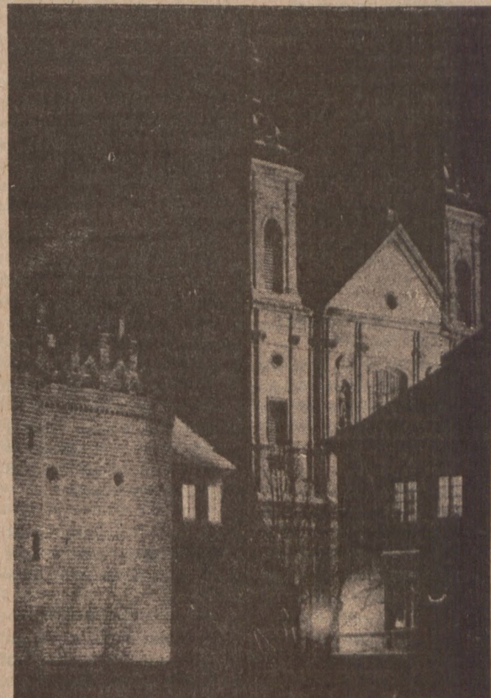
WARSZAWA — Stare Miasto w nocy.