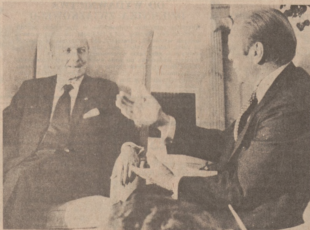
WASHINGTON. — Francuski Minister Spraw Zagranicznych Louis de Guiringaud, przebywający w Nowym Yorku w związku z trwającą sesją Generalnego Zgromadzenia ONZ, złożył wizytę Prez. Fordowi w Białym Domu.

Po dalsze informacje należy pisać wprost na następujący adres: — Grant-in-Aid Committee, Immigration History Research Center, University of Minnesota, 826 Berry Street, St. Paul, Minnesota 55114.