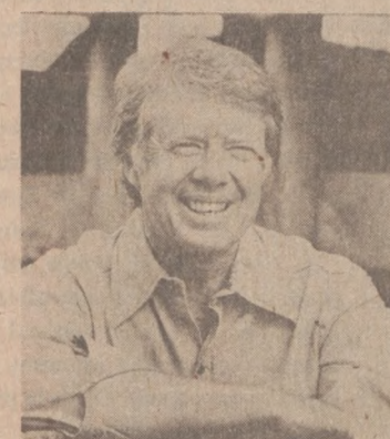
Jimmy Carter, demokratyczny kandydat na prezydenta.

Główne przemówienie wygłosił b. gub. Jimmy Carter, demokratyczny kandydat na prezydenta. Obszerne wyjątki z jego przemówienia podałyśmy w poniedziałkowym wydaniu (na str. 1-ej).