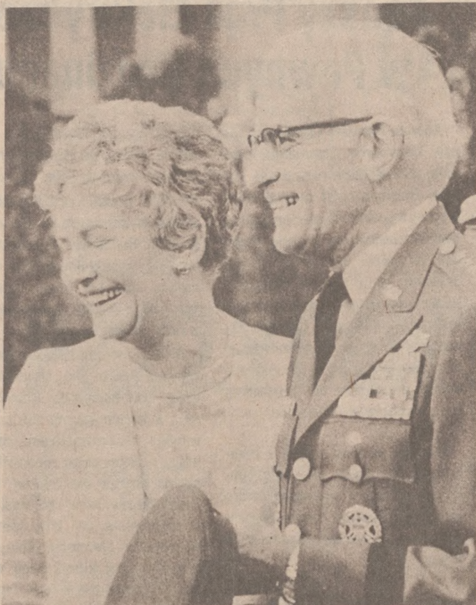
WASHINGTON.—Nowy Szef Sztabu Armii US gen. Bernard W. Rogers stoi z żoną po zakończeniu honorowych uroczystości w Pentagonie.