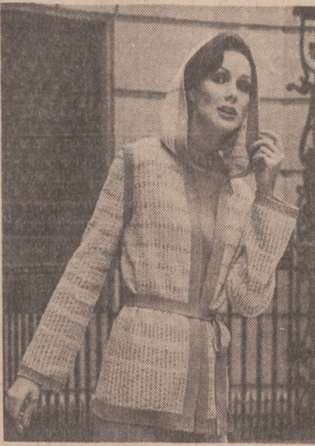
Modny sweter z orlonu w kolorze biało-granatowym lub beżowo-brązowym.