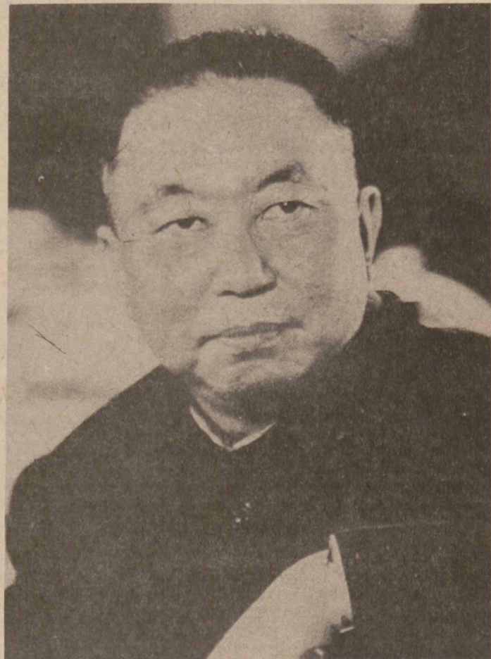
HONG KONG. — Hua Kuo-fang (na zdjęciu z 1976 r.) objął władzę w Chińskiej Republice Ludowej po śmierci Mao Tse-tunga.

● KUPUJCIE W SKŁADACH ● KTÓRE OGŁASZAJĄ SIĘ W DZIENNIKU ZWIĄZKOWYM