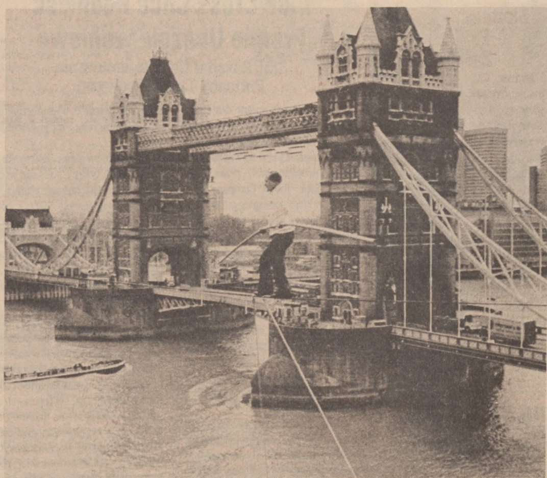
LONDYN — Światowej sławy linokoczek Karl Wallenda, lat 71, spaceruje po linie rozciągniętej nad Rzeką Thames wzdłuż słynnego London Tower Bridge.