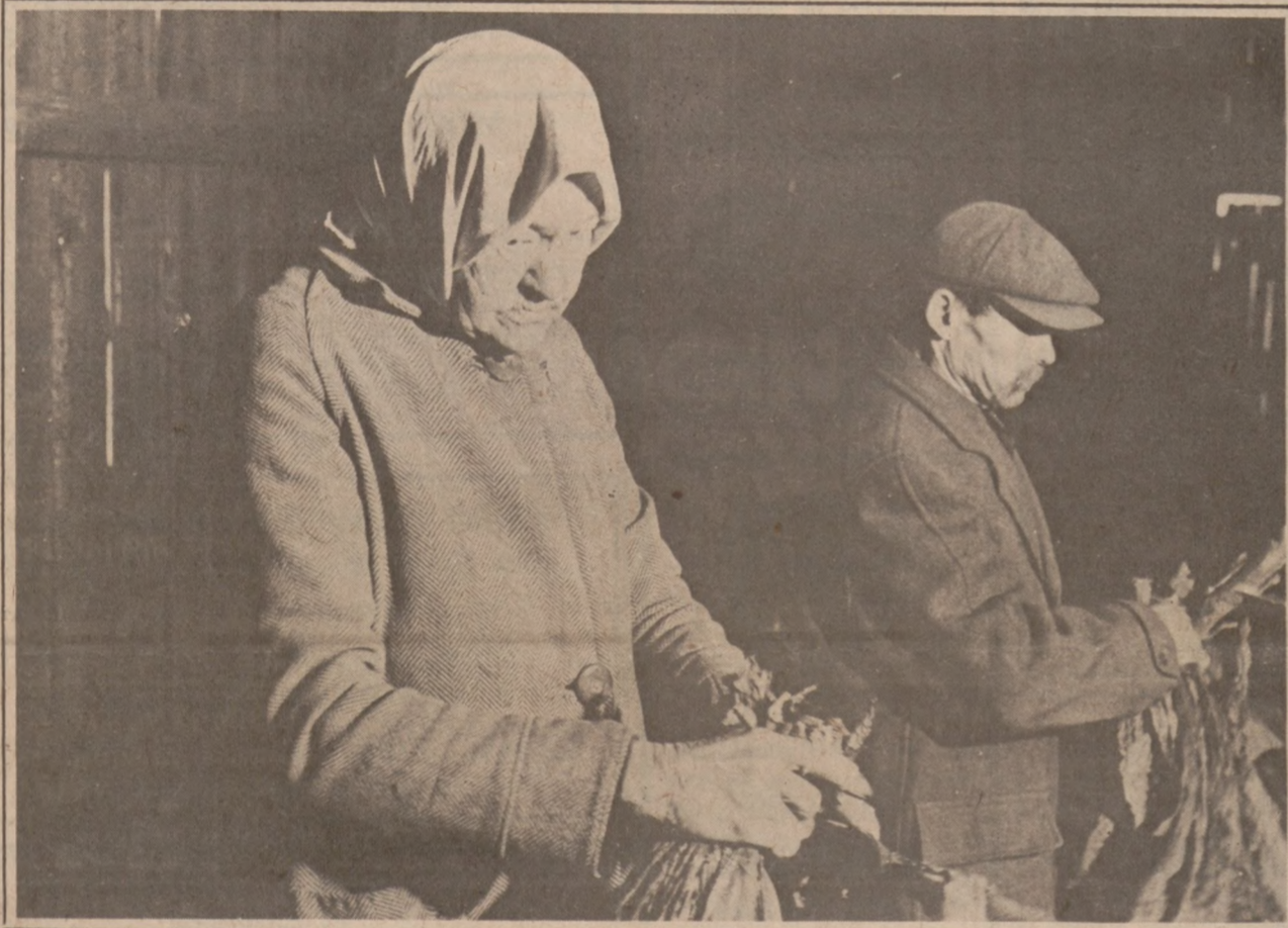
Stara Polska Kobieta Sortuje Tytoń, Connecticut, 1940

Zapisujcie Działkę Waszą Do Wydziału Małoletnich Z.N.P.