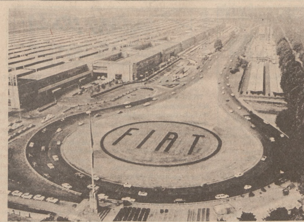
TURYŃ, WŁOCHY. — Widok ogólny fabryki Fiata z torem do badania sprawności nowych samochodów. Prezes firmy Gianni Agnelli ogłosił w czasie konferencji prasowej, że Libia wykupiła 10 procent akcji Fiat.

W piątki od 10.30 rano do 2 po południu w siedzibie Alliance — Spółka Pożyczkowa, 5359 W. Fullerton ave (na rożnik Long ave.), telefon 237-5300.