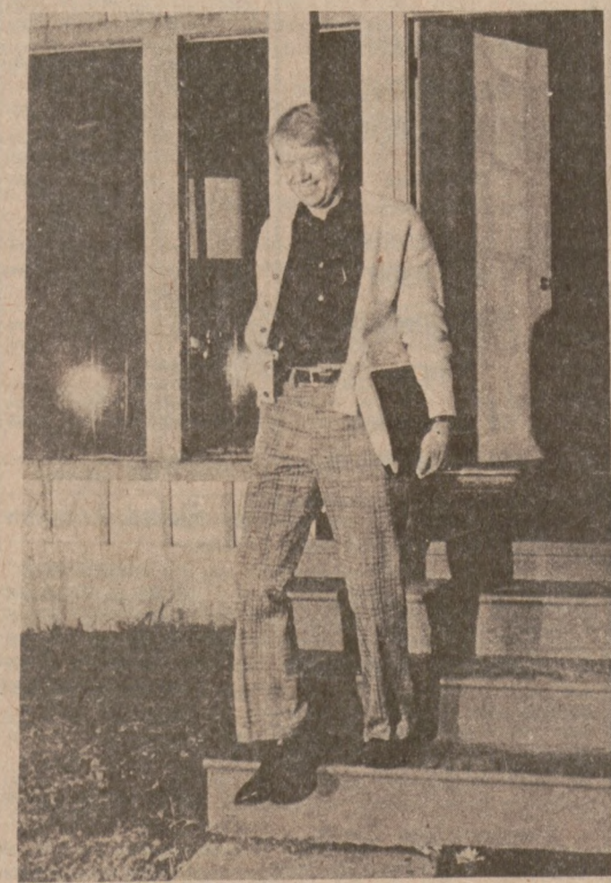
PLAINS, GA. — Prezydent-elekt Jimmy Carter opuszcza Pond House po konferencji z 16 ekonomistami z całego kraju. Wiceprezydent-elekt Walter Mondale również był obecny na konferencji.