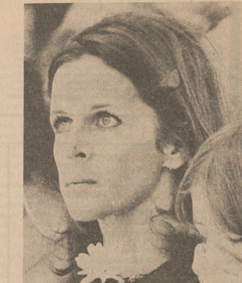
ASPEN, COLO. — W Aspen rozpoczął się proces aktorki i piosenkarki Claudine Longet oskarżonej o zamordowanie czempiona narciarskiego Vladimira Sabich.