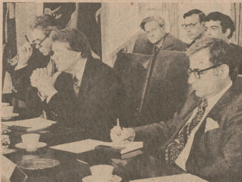
WASHINGTON. — Prezydent Carter w czasie pierwszej konferencji ze swoim gabinetem. Z tyłu za prezydentem widoczni są doradca do spraw bezpieczeństwa narodowego Zbigniew Brzeziński (po lewej) i dwaj inni doradcy.

Między innymi, Thompson proponuje ograniczyć łączny wzrost w wydatkach do $300 milionów, z czego $100 milionów zostanie przeznaczonych na wydatki Regionalnej Agencji Komunikacyjnej w rejonie chicagowskim, pozostawiając jedynie $200 milionów na inne wydatki.