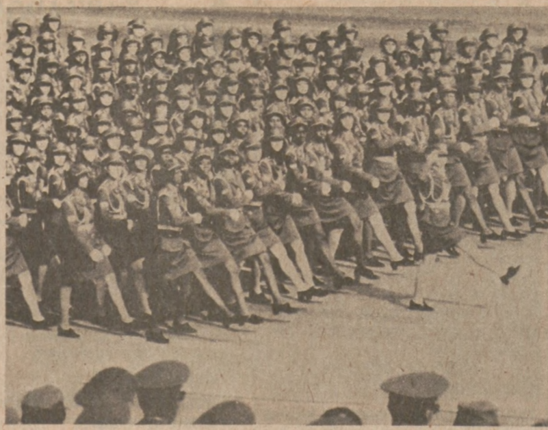
HAWANA. — Pluton kobiet maszeruje w czasie parady w Hawanie. Prezydent Carter niedawno oświadczył, że jest gotów wznowić stosunki dyplomatyczne z Kubą jeżeli wycofane zostaną wojska kubańskie z południowej Afryki i jeżeli Kuba spełni szeregi innych warunków.