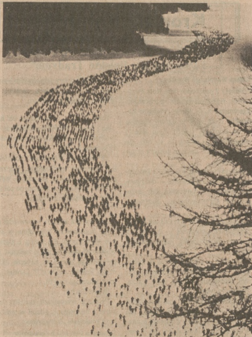
SILVAPLANA. — SZWAJCARIA. — Rekordowa liczba zawodników wzięła udział w tegorocznym maratonie narciarskim, który odbył się w miejscowości Silvaplana. W maratonie startowało 9,801 uczestników.

Burze wiosenne przepowiadane są przez stacje meteorologiczne w stanach South Dakota, Iowa, Nebraska i Illinois. Zawieje śnieżne przypuszczalnie wystąpią w dolnej części stanu Michigan.