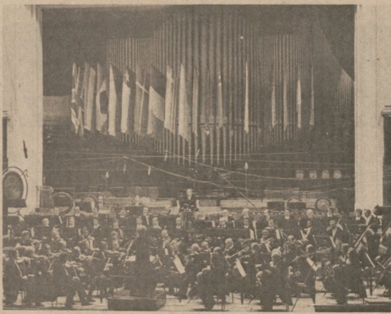
"XX Warszawska Jesień" w Filharmonii Narodowej

Filharmonia Warszawska zorganizowana została w 1901 r. przez grono zamożnych mecenasów muzyki w formie spółki akcyjnej i w tym charakterze przechodząc wiele kryzysów finansowych do 1039 r. jako czołowa instytucja szerząca kulturę symfoniczną w Polsce. Od 1955 r. przemianowana została na Filharmonię Narodową.