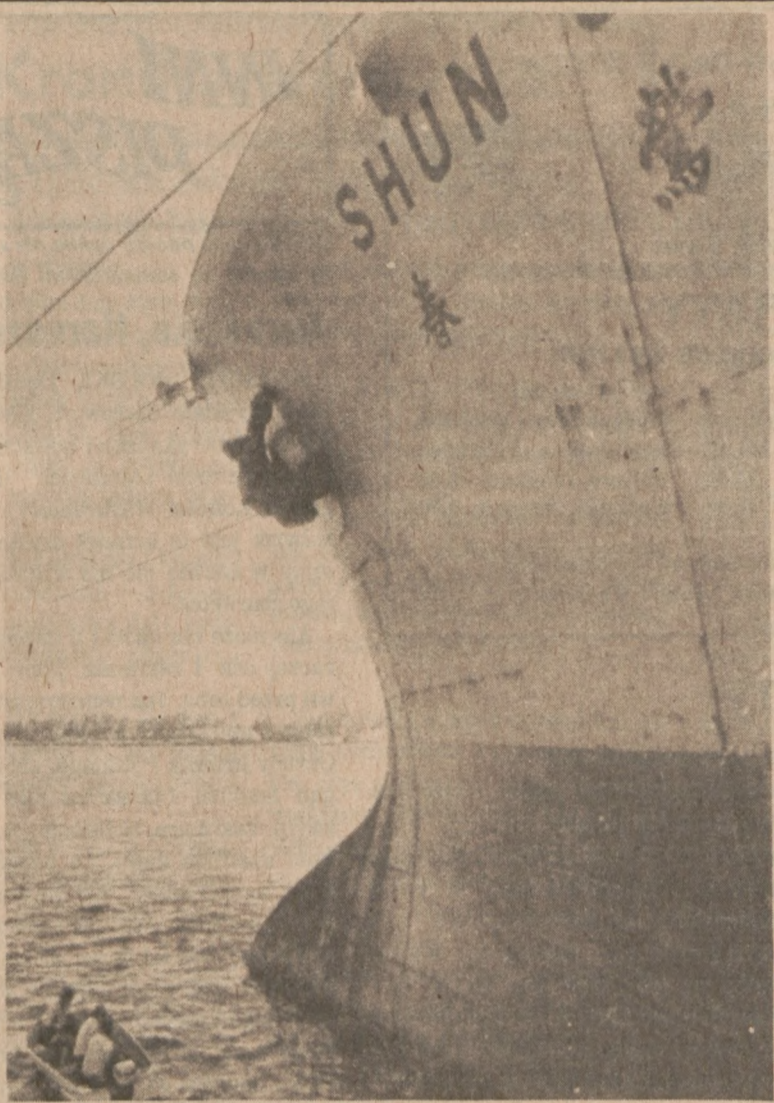
BRISBANE, AUSTRALIA. — Policja i urzędnicy portowi badają dziób frachtowca Shun Oh, który zderzył się z łodzią rybacką w czasie ubiegłego weekendu. Dwaj pasażerowie łodzi zostali pożarci przez rekiny, a trzeci ocalał i znajduje się obecnie w szpitalu. (UPI)

O — ileż mąk, ileż cierpienia, O — ileż krwi, wylanych łez Pomimo to nie ma wątpienia, Dodaje sił wędrowki kres. My Pierwsza Brygada i t.d.