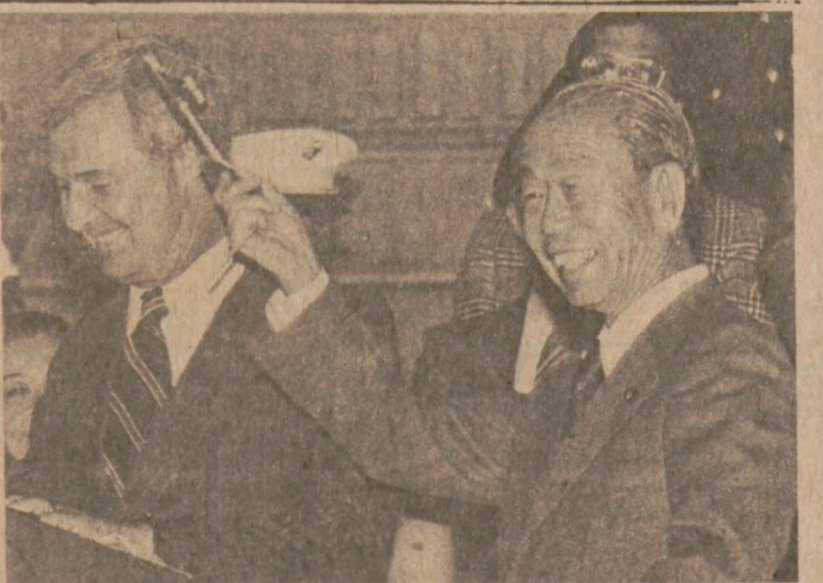
SAN FRANCISCO. — Premier Japonii Takeo Fukuda, przebywający z wizytą w Stanach Zjednoczonych, widoczny na zdjęciu z kluczami do miasta San Francisco, które otrzymał z rąk mayoara George'a Moscone (po lewej).

Rzecznik departamentu oświadczył, że mikrofilmy przypuszczalnie były przechowywane w biurze dyrektora w okresie pomiędzy sierpniem, 1974, a listopadem, 1976. Poszukiwane dokumenty Departamentu Ubezpieczeniowego pochodzą z niektórych okresów w latach 1973 i 1974.