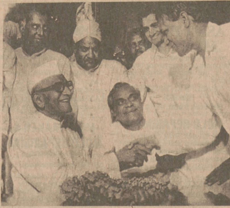
NEW DELHI. — Morarji Desai, lat 81, został wybrany następnym premierem Indii. Na zdjęciu, Desai przyjmuje gratulacje od niezidentyfikowanego członka Partii Janata.

Szkola Brook View była niedawno odnowiona.