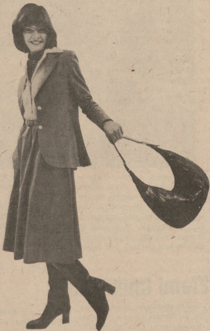
Modny kostium wiosenny z lekkiej wełny w dowolnym kolorze i skórzana torebka.