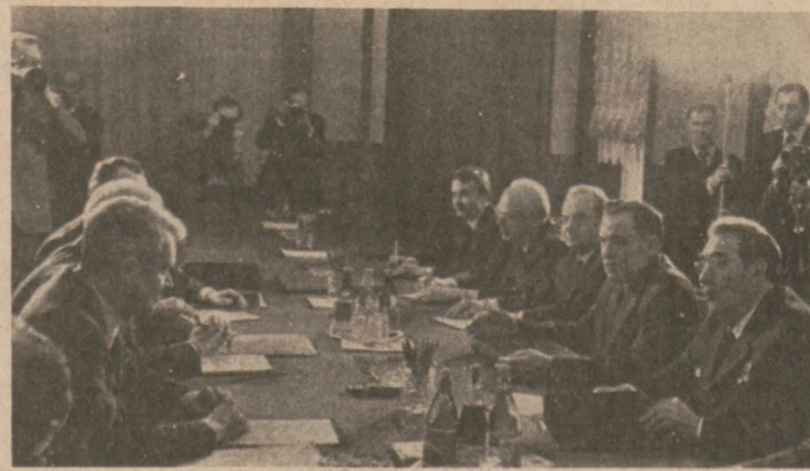
MOSKWA. — Sekretarz Stanu U.S. Cyrus Vance (po lewej) i Leonid Breżniew siedzą vis-a-vis w czasie rozmów na temat ograniczeń zbrojeniowych. Drugi od prawej, sowiecki minister spraw zagranicznych Andrei Gromyko.

Politycy chcą aby pieniądze zamiast do kieszeni elementu przestępczego szły do skarbcza publicznego, albowiem skuteczne zapobieganie uprawianiu hazardu jest praktycznie niemożliwe.