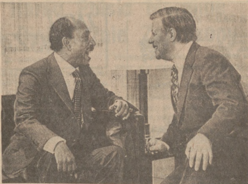
Bonn, NRF. — Prezydent Egiptu Anwar Sadat w czasie konferencji z kanclerzem NRF Helmutem Schmidtem. Po złożeniu wizyty w Bonn, Sadat udał się do Francji, a następnie do Stanów Zjednoczonych.

Zawiadamiamy wszystkich członków Oddz. "Odra-Wrocław" o "Święconym", które odbędzie się w sobotę, 16 kwietnia, o godz. 5-jej po południu, u Ojców Jezuitów, 4105 N. Avers. Zgłoszenia należy kierować na telefon sekretarza: 486-1299 do piątku. — Zarząd Oddz. "Odra-Wrocław".