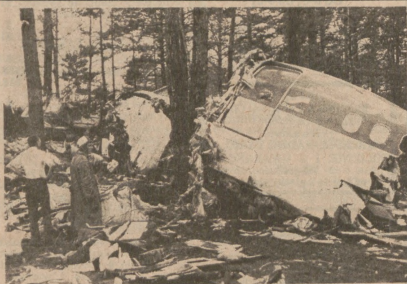
DALLAS, GA. — Inspektorzy FAA badają kabinę odrzutowca linii Southern Airways, który rozbił się w czasie gwałtownej burzy. 68 osób poniosło śmierć w wypadku.

OBSZERNE informacje przeczytasz i najlepsze zdjęcia zobaczysz w Dzienniku Związkowym.