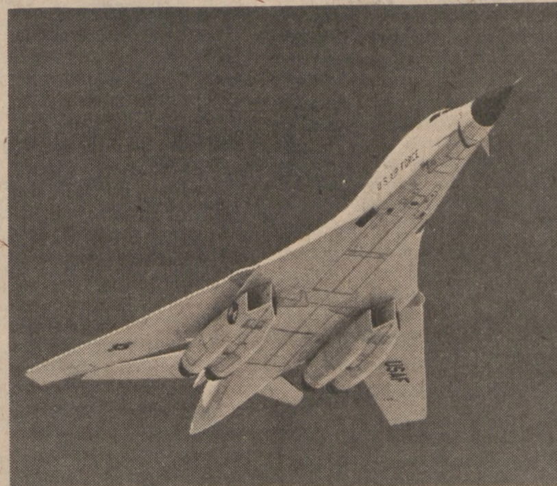
Nowy bombowiec strategiczny B-1 otrzymał nagrodę Roberta J. Collier przyznawaną każdego roku przez Krajowy Związek Aeronautyczny za największe osiągnięcia w dziedzinie lotnictwa w Ameryce.