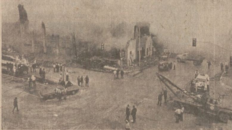
CHICAGO. — Pełniący obowiązki mayor Michael A. Bilandic (po środku) przyjmuje gratulacje po swoim zwycięstwie w prawyborach partii demokratycznej. Przeciwnikiem Bilandica w czerwcowych wyborach na mayora będzie Republikan Dennis Block.

Przeciw Valente władze prowadzą dochodzenia, gdyż podejrzewają, że był on odbiorcą kradzionych towarów. Policja przypuszcza, że materiały wybuchowe przeznaczone były do otwierania kas ogniowatych lub zastraszania właścicieli sklepów i innych miejscowych przemysłowców.