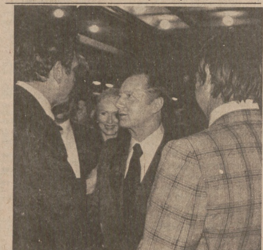
GALVESTON, TEKSAS. — Pożar zniszczył pięciopiętrowy hotel w śródmieściu Galveston. Przynajmniej cztery osoby zginęły w płomieniach. (UPI)

Biuro Social Security w śródmieściu zostało otwarte pod nowym adresem w Insurance Exchange Building, 175 W. Jackson, Suite A-1111. Poprzednio biuro mieściło się pnr. 22 Madison, gdzie było zbyt mało miejsca dla coraz większej liczby interesantów. Godziny pozostają bez zmian: od 9 rano do 4:45 po południu, od poniedziałku do piątku włącznie.