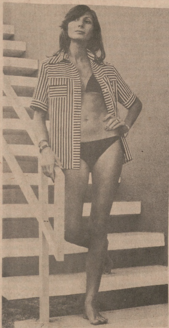
Bluzka w paski czarno-białe jest wygodnym dodatkiem do "bikini".