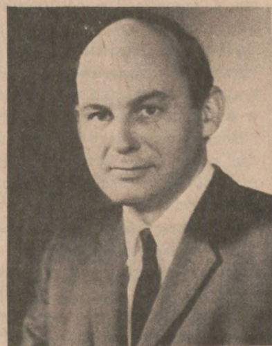
SEN. ADLAI E. STEVENSON

W 1966 roku wybrany został stanowym skarbnikiem. W 1970 zaś roku ubiegał się o urząd Senatora przeciw