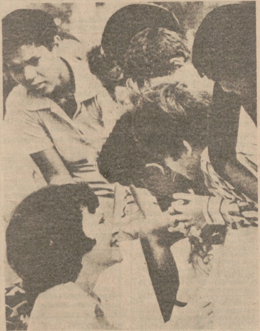
RECIFE, BRAZYLIA. — Rosalynn Carter zwiedziła ośrodek opieki nad dziećmi w Recife. Spotkała się również z amerykańskimi misjonarzami, którzy opowiedzieli jak niesłusznie zostali osadzeni w brazylijskim więzieniu, gdzie byli bici i głodzeni.

Kierowcom, którym wygasa czasokres licencji ale nie muszą wykonać pisemnego egzaminu ani za kierownicą, mogą tylko przesłać $8 na odnowienie lub udać się osobiście do stacji prowadzącej egzamin, dla uzyskania nowego z fotografią, prawa jazdy.