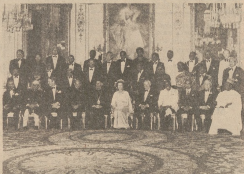
LONDYN. — Królowa Elżbieta II pozuje do zdjęcia z wysokimi urzędnikami państwowymi w czasie przyjęcia wydanego przez królową w Pałacu Buckingham.