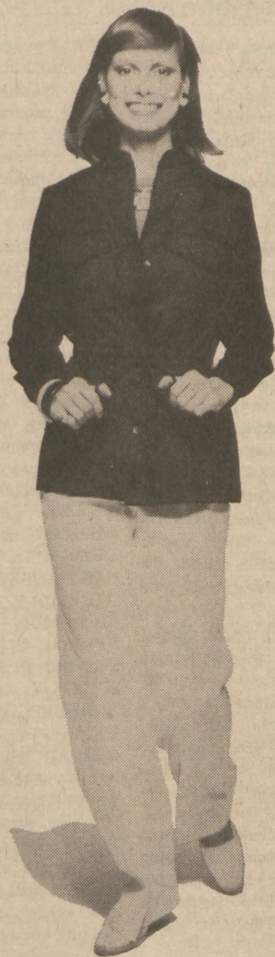
Jasne spodnie i ciemna kurtka z bawełny — strój odpowiedni do wycieczek podczas chłodniejszych dni.