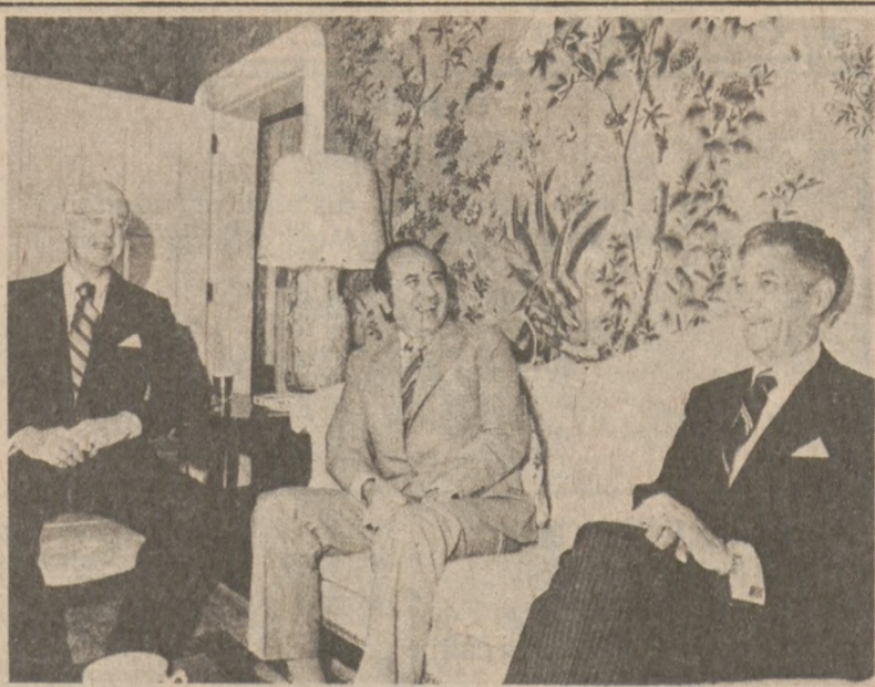
WASHINGTON. — Prezydent Wenezueli Perez (po środku) spotkał się w Waszyngtonie z Ellsworthem Bunker (H.B.) Thompsonem, przedstawicielem U.S. w negocjacjach dotyczących Kanału Panamskiego.