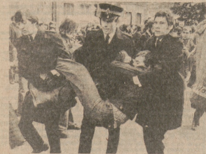
LONDYN. — Policjanci aresztują jednego z demonstrantów usiłujących zagrozić drogę do fabryki Grunwick. Od 45 tygodni trwa spór dotyczący żądań stawianych przez unię pracowników biurowych.

Kilkanaście czeków znaleziono później na parkingu położonym o kilka ulic od sklepu.