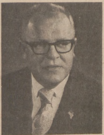
KONGRESMAN ED DERWINSKI

Kongresman Edward Derwinski (R-4) zostanie uhonorowany na Bankiecie Uznania, połączonym z zabawą taneczną, w piątek, 14-go października, w Sabre Room, 8900 West 95 ulica, w Hickory Hills.