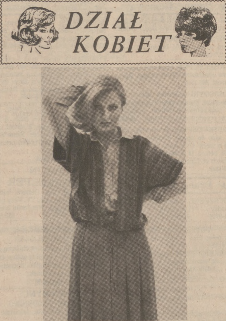
Układana spódnica i wełniany sweterek zakładany na koszule z długim rękawem i wykładanym kołnierzykiem.