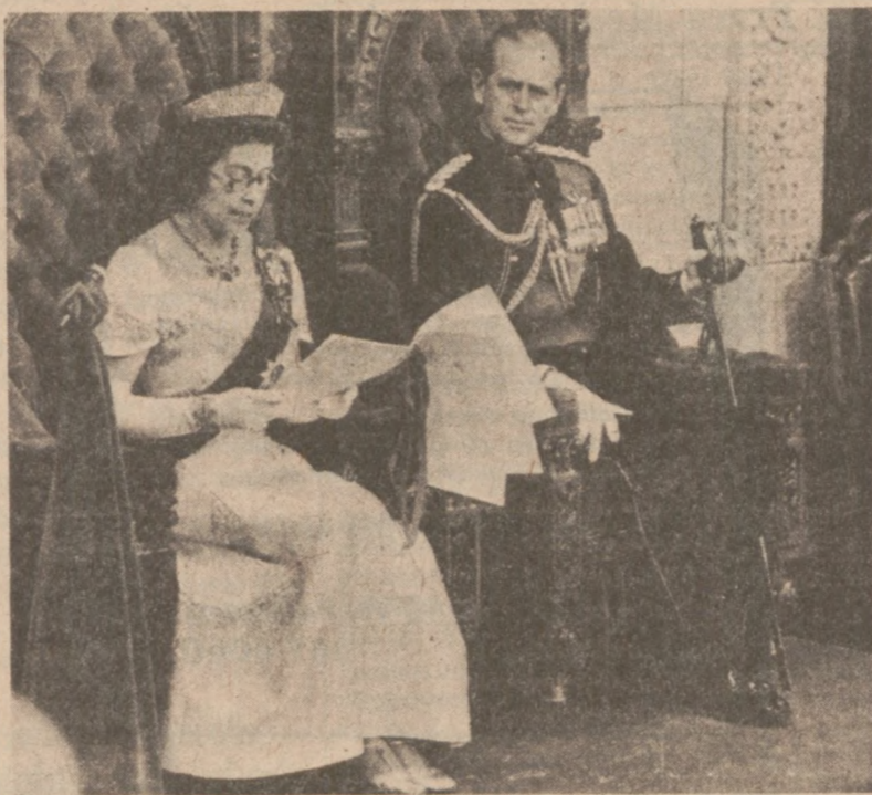
OTTAWA. — Królowa angielska Elżbieta II — po raz pierwszy publicznie w okularach! — odczytuje swe przemówienie otwierające trzecią sesję parlamentu kanadyjskiego. Po zakończeniu swego pobytu w Kanadzie Królewska para udała się na wyspy Karaibskie.

McDonald dodał w swojej wypowiedzi, że jego agencja będzie wspominać oddział stanowy, za każdym razem, kiedy dopuści się na jakiś niedopatrzenia, a jeżeli nie naprawi swoich błędów "wkroczy do akcji i odbierzemy jemu uprawnienia".