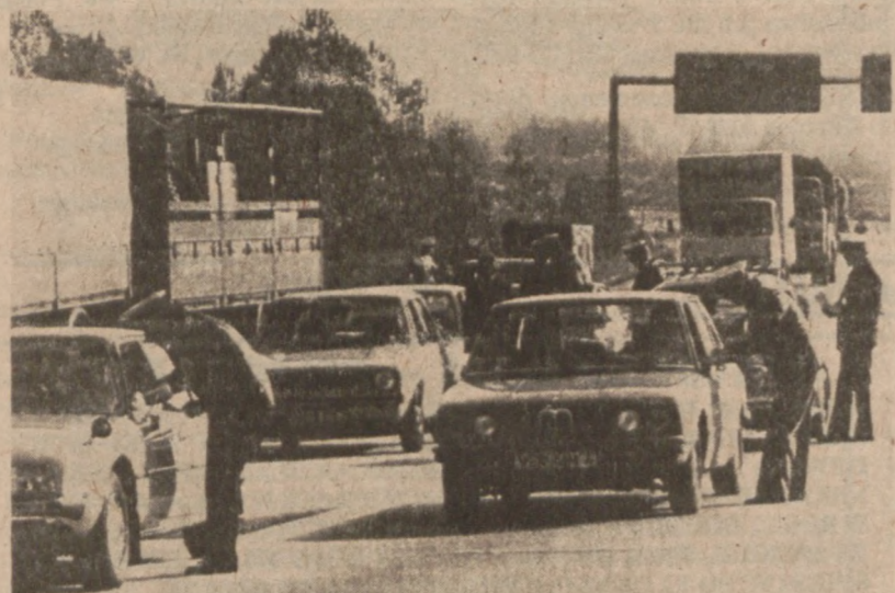
BREMA. — Policja w trakcie kontroli samochodów na przedmieściach Bremy. Całe Niemcy Zachodnie objęte są energiczną akcją policyjną, mającą na celu odnalezienie grupy terrorystów odpowiedzialnych za śmierć Hansa Martina Schleyera.