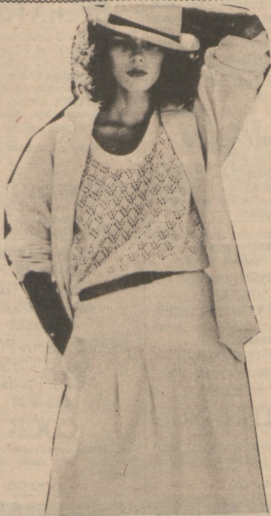
Azurowa bluzka z welenki, blezer i spódnica z kilkoma fałdami z przodu — całość dopełniona kapeluszem — stanowi ciekawy strój na ciepłe jesienne popołudnie.