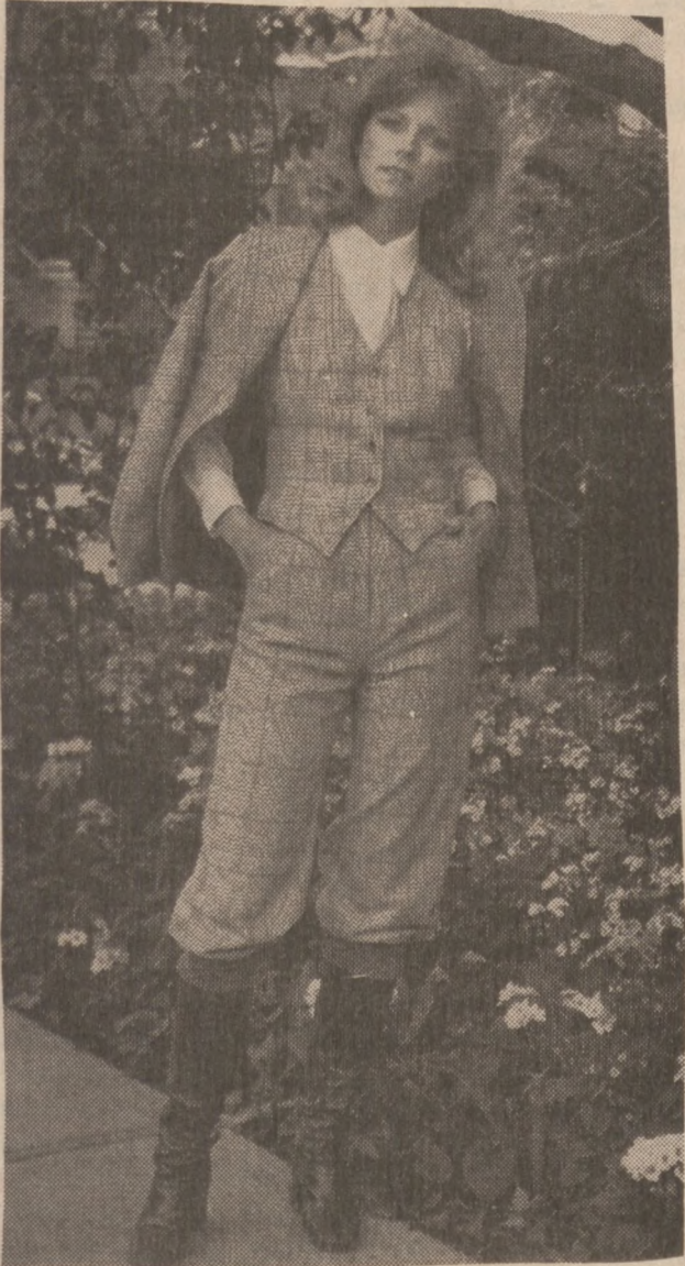
Sportowy strój w stylu kalifornijskim, odpowiedni na jesienną wycieczkę do parku.