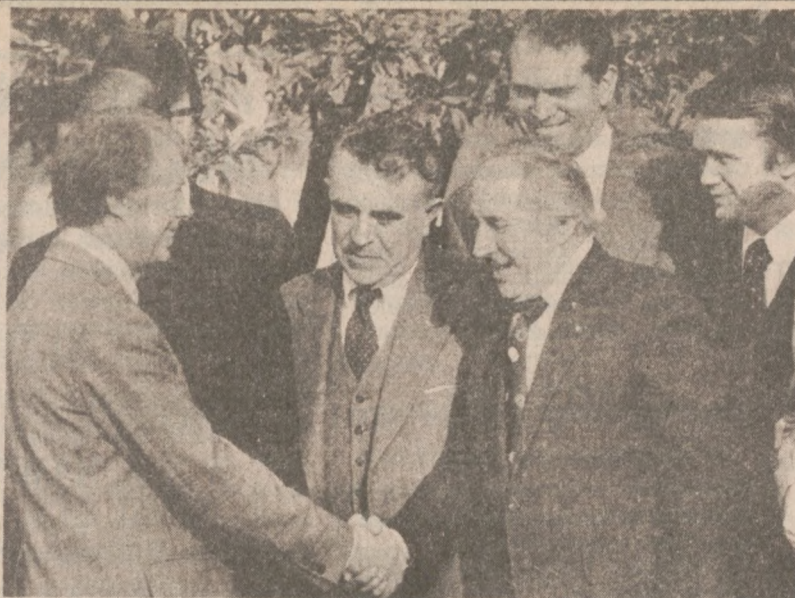
WASHINGTON. — Prezydent Carter wymienia uścisk dłoni z Peterem Rodino (D. Nowy York) po podpisaniu ustawy przyznającej uciekinierom z Indochin prawo stałego pobytu w Stanach Zjednoczonych oraz zezwalającej na wymianę więźniów z Kanadą i Meksykiem.

Rada Szkół wyższych przedyskutuje przedstawiony jej projekt budżetu i przedstawi swoje z kolei wnioski za kilka tygodni, prawdopodobnie w grudniu. Przypuszcza się, że głosowanie nad budżetem odbędzie się w styczniu, a następnie cały plan, wraz z wnioskami i uwagami Rady przesłany będzie do gubernatora i Legislatury stanowej.