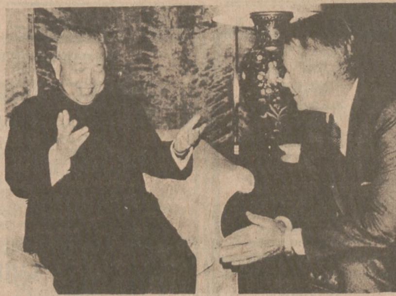
WASHINGTON. — Sekretarz Stanu Cyrus Vance rozmawia z szefem chińskiej misji dyplomatycznej, Huang Chen, w siedzibie Departamentu Stanu, na krótko przed powrotem tego dyplomaty

W końcu rzucił się na jednego z przechodniów, powalił go na ziemię i groził podcięciem gardła. Przybyła na miejsce policja uwolniła przechodnia wcześniej raniąc Scotta w ramię.