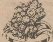
Nr. 5 Regularna Cena $900