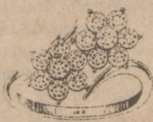
Nr. 1 Regularna Cena $840

WIELKI WYBÓR BIZUTERII Z BRYLANTAMI WPROST Z NASZEJ WYTWÓRNI