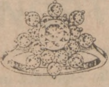
Nr. 6 Regularna Cena $850