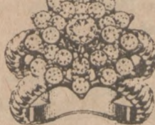
Nr. 8 Regularna Cena $980