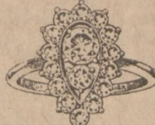
Nr. 2 Regularna Cena $680