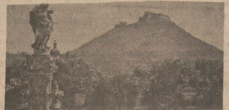
KRZEMIENIEC. — Góra Królowej Bony.