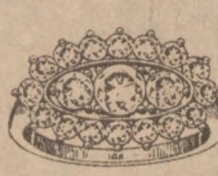
Nr. 7 Regularna Cena $820