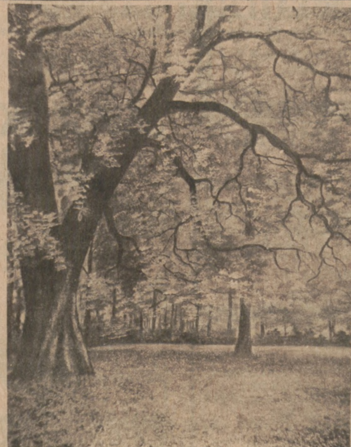
Jeśli na Plantach w Krakowie

Pisarze ci nie są specjalnie znani w Polsce ani na Zachodzie. Jest to oczywiście pisarze rosyjscy przebywający albo w więzieniach albo odjechali na Zachód.