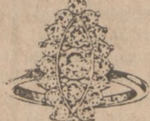
Nr. 4 Regularna Cena $680