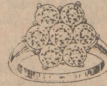
Nr. 10 Regularna Cena $960