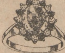
Nr. 9 Regularna Cena $560