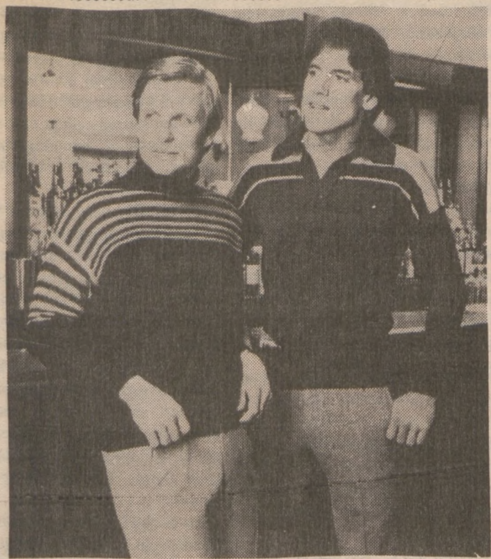
Tym razem coś dla panów — sweterki z akrylu ze wzorem z pasków.