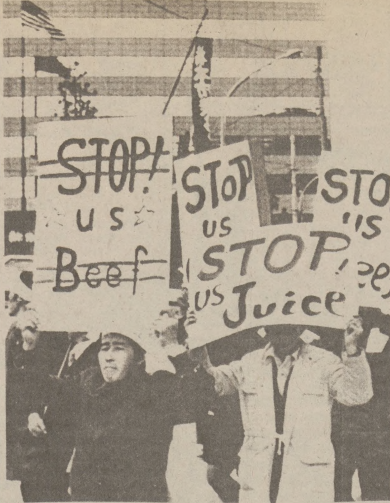
JAPONIA. Farmerzy japońscy przemarszerowali ulicami Tokyo demonstrując przeciwko importowi amerykańskich artykułów spożywczych do tego kraju. Na pierwszym planie demonstranci niosą plakaty, w głębi widoczny gmach ambasady amerykańskiej

Orzeczenie sędziego Egly'ego zostało przyjęte z zaskoczeniem ponieważ w tym tygodniu władze szkolne miały rozpocząć serię przesłuchań publicznych na temat proponowanego planu integracyjnego. Sąd najwyraźniej uznał jednak, iż przesłuchania te zajęłyby przynajmniej kilka miesięcy, uniemożliwiając później rozpoczęcie integracji już od września '78 r.