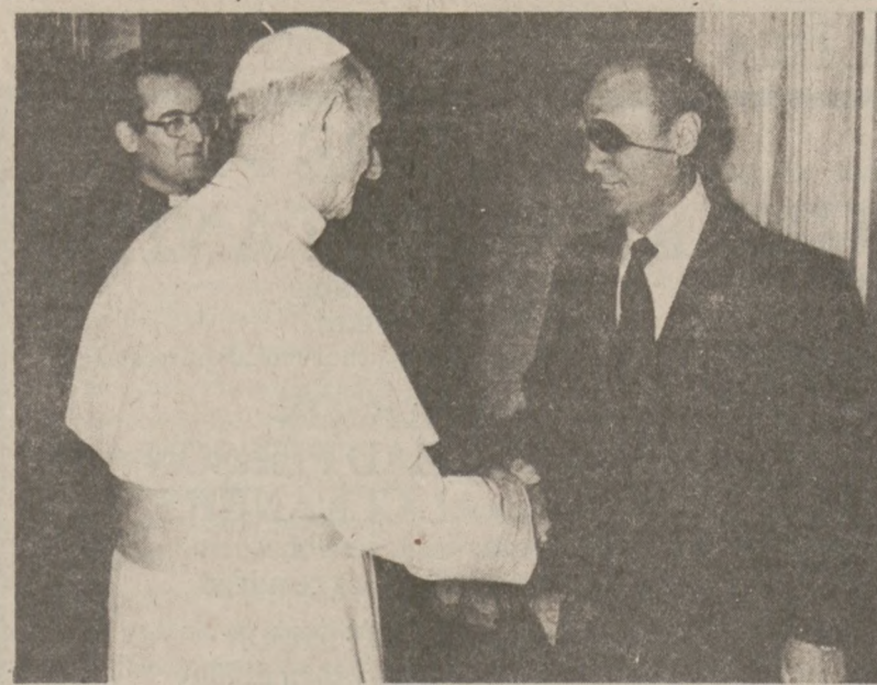
WATYKAN. — Papież Paweł VI przyjął tu na specjalnej prywatnej audiencji w dniu 12 stycznia Ministra Spraw Zagranicznych Izraela, Moshe Dayana.

Nowy budynek powstanie w pobliżu gmachu Loyola's School of Business, Education and Social Work.