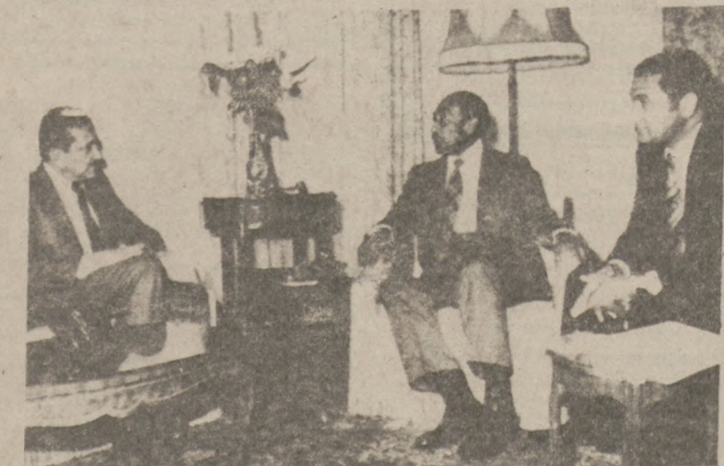
EGIPT. — Prezydent Egiptu Anwar Sadat (w środku) spotkał się w Assuanie z izraelskim Ministrem Obrony Ezerem Weizmanem (po lewej), aby przedyskutować węzłową dla osiągnięcia pokoju sprawę wycofania się Izraela z Synaju. W rozmowach wziął również udział wiceprezydent Husni Mubarak (po prawej).

Atrakcyjna blondynka weszła wczoraj do Upper Avenue National Bank, 875 N. Michigan Avenue, z uśmiechem podeszła do okienka kasjerki oświadczaając, że ma rewolwer po czym wręczyła kasjerce kartkę ze słowami "mam w torebce rewolwer. Bądź rozsądna to nic ci się nie stanie." Kasjerka wręczyła jej $4,793, które kobieta włożyła do torebki i spokojnym krokiem wyszła z banku.