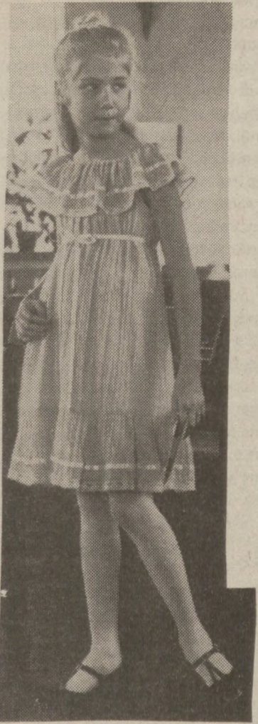
Sukienka dla dziewczynki z lekkiego bawełnianego materiału.