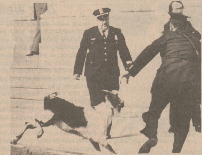
WASHINGTON. — Policja przed gmachem Kapitolu w obławie za przerażoną kozą, jedną z wielu jakie protestujący farmerzy wypuścili tu w dniu 15 marca. Kozie ani się kiedykolwiek marzyło, że znajdzie się w tak dostojnym miejscu.