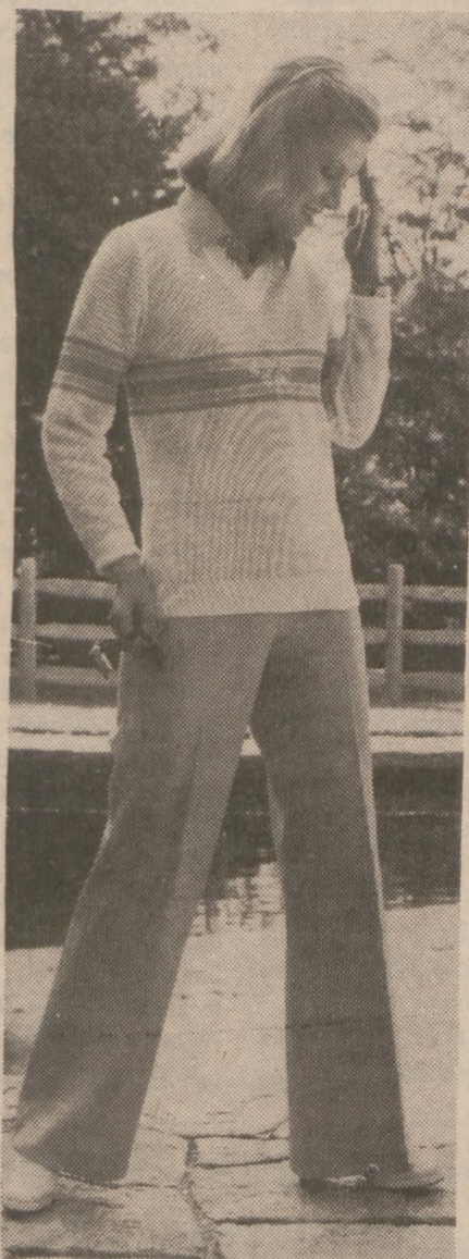
Komplet na wiosenną przechadzkę.