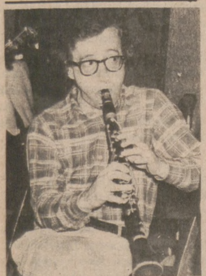
New York — Woody Allen — zdobywca dwóch Oskarów, za najlepszą reżyserię i najlepszy film roku, którym był film pt. "Annie Hall", gra na klawirze w jednym z nowojorskich klubów, w czasie, gdy trwają uroczystości Oskara. Woody stwierdził, że nie może sprawić zawodu członkom orkiestry z którą występuje.