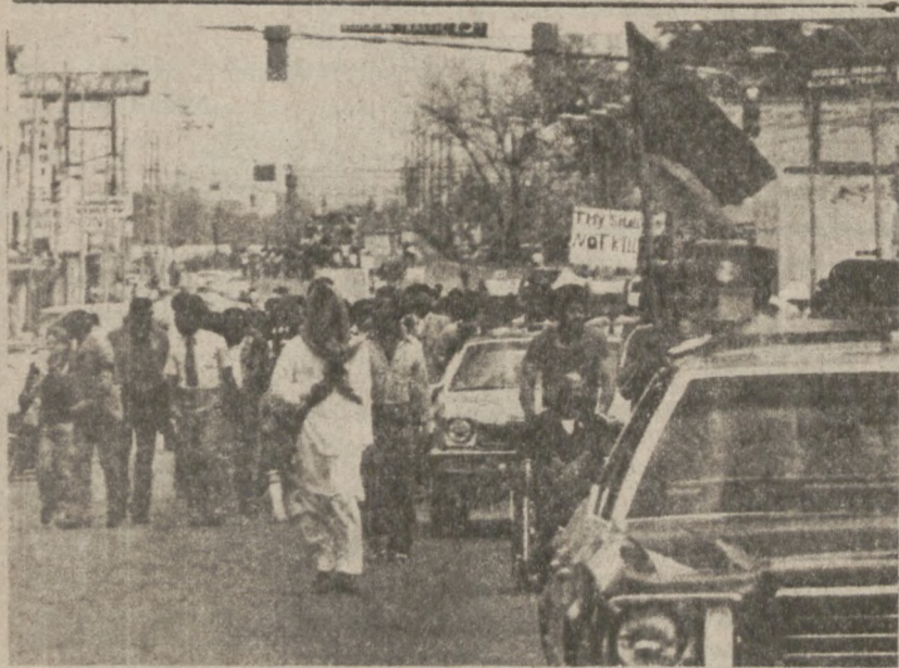
GADSEN, ALABAMA. — Około 2,000 osób brało udział w marszu dla uczczenia 10 rocznicy zamordowania Martina Luthera Kinga Jr. Uczestnicy marszu śpiewali pieśni śpiewane przez demonstrantów w 1960 r. Temat parady: "Prawo do życia".

Miasto płaci olbrzymie sumy pieniędzy kompanii, która powinna kontrolować i naprawiać liczniki. Oblicza się, że roczny koszt takiej naprawy wynosi ok. $38.00 za jeden licznik. Jest to suma o wiele wyższa niż ta, którą płać inne miasta. Dla porównania Filadelfia płaci $23, Los Angeles $20 a Houston mniej niż $5.