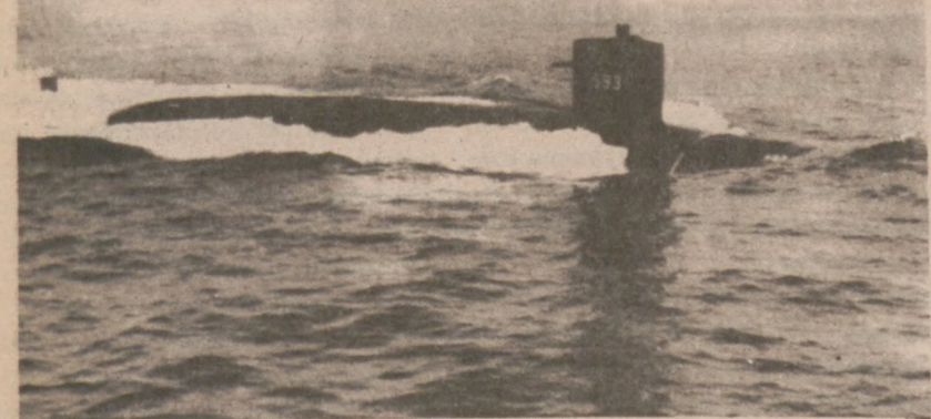
BOSTON — The Thresher, była uważana za najlepszą, najbardziej unowocześnioną łódź podwodną w czasie kiedy miała dokonać swego pierwszego zanurzenia — 15 lat temu. Niestety, łódź nigdy nie wróciła na powierzchnię oceanu. Utonęła na dnie oceanu Atlantyckiego na 220 mil na wschód od Cape Cod, mając na pokładzie 129 osób obsługi. Wszyscy zginęli.

Zarząd Koła Rodzicielskiego przy polskiej szkole im. Henryka Sienkiewicza w Cicero, IL., uprzejmie informuje Polonię, że 22 kwietnia 1978 r., w sali szkolnej przy parafii Sw. Walentego, 4940 W. 13th St., Cicero, IL., odbędzie się zabawa taneczna pt. "Spotkanie z Wiosną". Początek zabawy o 8 wieczorem. Do tańca przygrywać będzie znana i przez wszystkich lubiana orkiestra. Bar i bufet obficie zaopatrzone w polskie i amerykańskie smakołyki. Aby umożliwić wszystkim wzięcie udziału w imprezie opłata za wstęp jest minimalna, bo tylko $4. Mammy także niespodzianki w trakcie zabawy. Tych, którzy jeszcze nigdy nie uczestniczyli w naszych zabawach zapewniamy, że wszyscy bawią się doskonale. Dochód z zabawy przeznaczony jest całkowicie na potrzeby polskiej szkoły. Po rezerwacji miejsc prosimy dzwonić: 581-1275, cały dzień bez ograniczeń. Bilety można także wykupić w każdą sobotę w szkole lub bezpośrednio przed zabawą. Do zobaczenia na "Spotkaniu z Wiosną". — Zarząd Koła Rodzicielskiego.