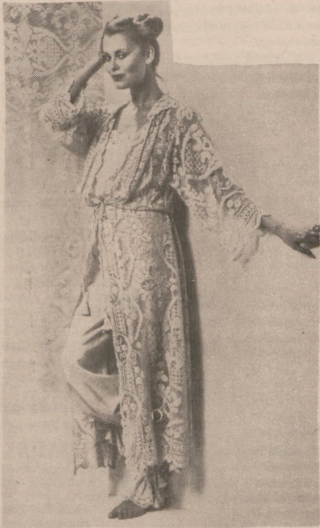
Komplet stylowej bielizny nocnej.