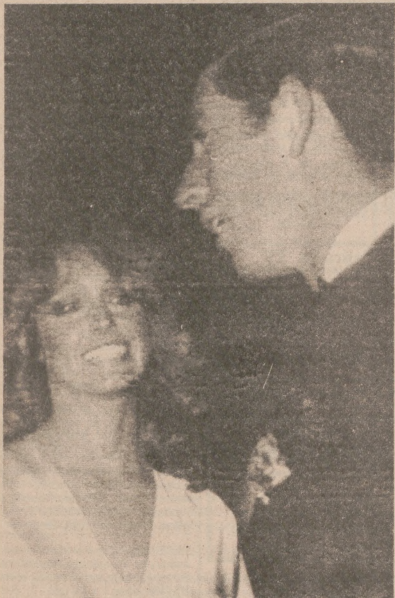
FARRAH FAWCETT-MAJORS w rozmowie z księciem Charles, angielskim następcą tronu, w czasie przedstawienia w londyńskim Palladium. Sarah prowadziła to przedstawienie, z którego dochód był przeznaczony na cele charytatywne.