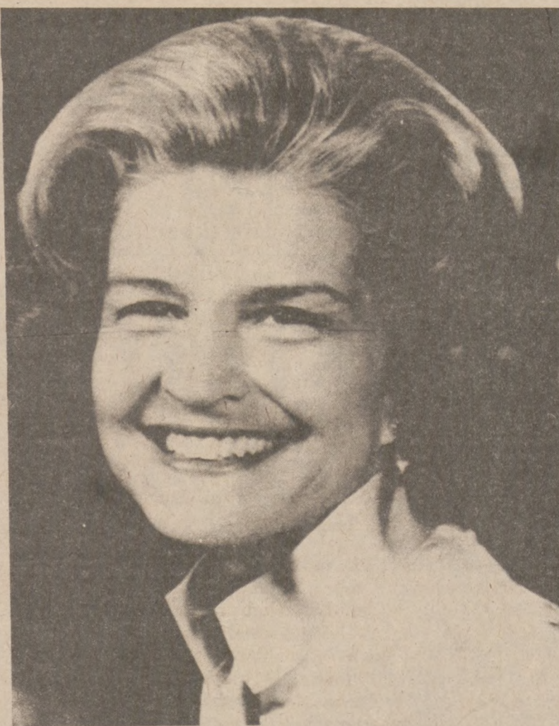
LONG BEACH, CALIF. — Betty Ford zgłosiła się do szpitala ponieważ, jak sama mówi, wpadła w nałóg używania lekarstwa uśmierzającego ból artretyczne. Doszło do tego, że czasem "używałam za dużo" lekarstw. Pani Ford skończyła 60 lat. Od kilku lat cierpi na artretyzm i inne dolegliwości.