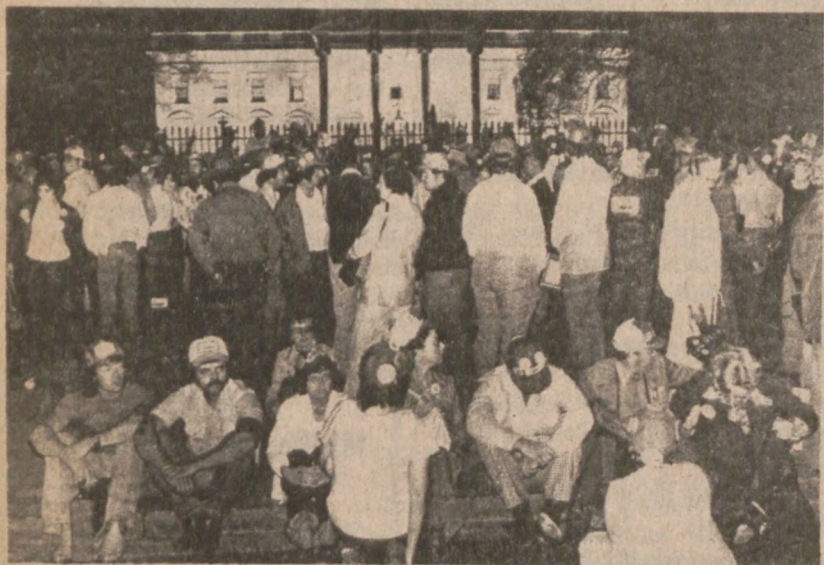
WASHINGTON — Oburzeni farmerzy zbierają się przed Białym Domem aby protestować przeciw ubiciu prawa przewidującego pomoc dla ich gospodarstw. Chodzi tu o "emergency farm bill". W tym samym czasie Prezydent Carter wydawał bankiet na cześć rumuńskiego Prezydenta.