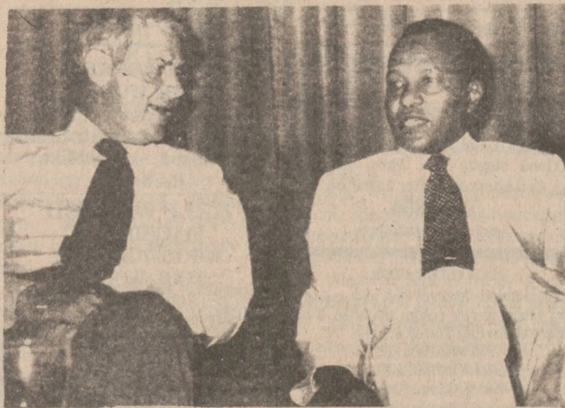
CHARTUM, SUDAN — Sekretarz Stanu Cyrus Vance (po lewej) w rozmowie z sudańskim wiceprezydentem i ministrem spraw zagranicznych Elrashidem Tahir Bakr'em. Vance zatrzymał się na 90 minut w tym kraju w drodze do Rodezji.