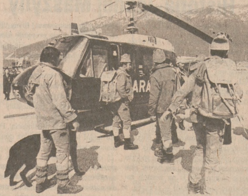
VALE DEL SALTO, WŁOCHY — Policjanci z specjalnie trenowanymi psami przygotowani do wyprawy w poszukiwaniu porwanego b. premiera Aldo Moro. Według listu porywaczy miano przeszukiwać jezioro Duches Lake.