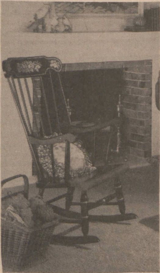
Stylowe krzesło bujane.