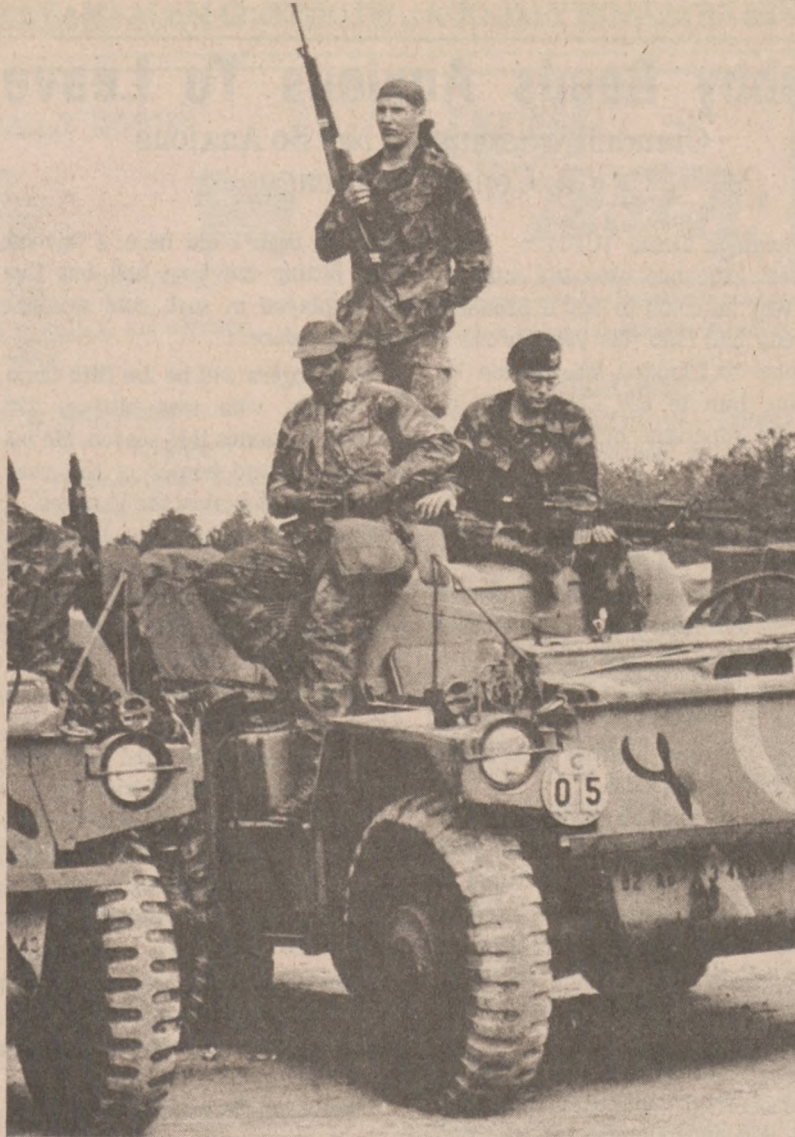
FORT BRAGG, N.C. — Żołnierze 82 Dywizji Kawaleri Powietrznej stoją w pogotowiu na ewentualność konieczności interwencji w ewakuacji Amerykanów z Zairu. Departament Stanu ogłosił jednak 17 maja, że interwencja taka nie będzie potrzebna.