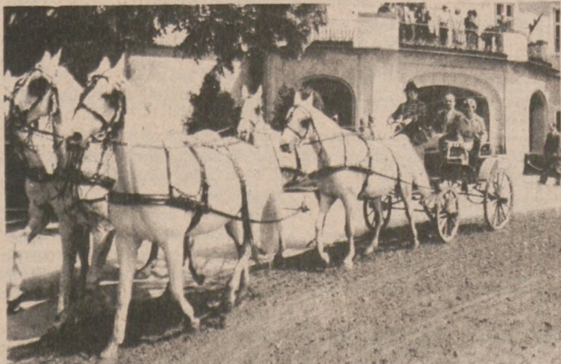
BABOLNA, WĘGRY. — Delegacja Stanów Zjednoczonych na której czele stoi sekretarz Dept. Rolnictwa Robert Bergland, zwiedziła lokalne Państwowe Gospodarstwo Rolne. Robert Bergland wraz z małżonką jechali powozem zaprzężonym w pięć śnieżno-białych rumaków.

Zamboanga, Filipiny — Mułmańscy rebelianci na Filipinach nieoczekiwanie zwolnili 56 zakładników, w tej liczbie 3 kobiety i 5 dzieci, których 24 dni temu wzięli do niewoli po opanowaniu statku handlowego, kursującego na trasach lokalnych. Uwolnionych pozostawiono na plaży Buton na wyspie Basilan, skąd helikopterami i małymi kutrami wojsko filipińskie przewiozło ich do miasta Zamboanga.