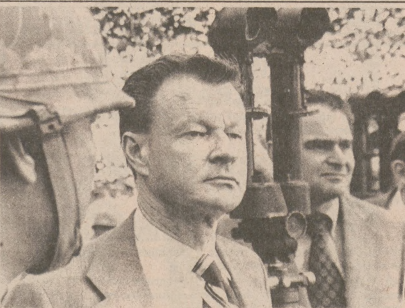
SEUL. — Zbigniew Brzeziński, doradca Prezydenta Cartera d/s bezpieczeństwa kraju, w czasie swej misji dyplomatycznej w Korei.