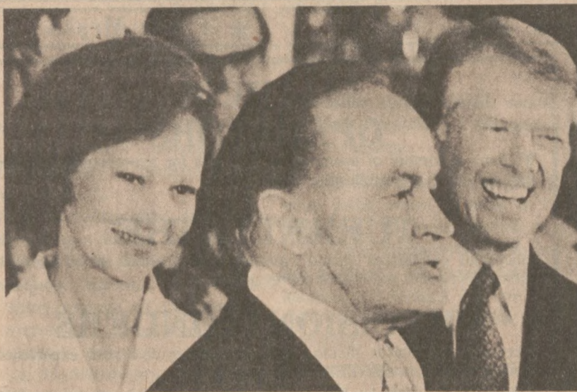
WASHINGTON — Pierwsza Rodzina była gospodarzami przyjęcia urodzinowego dla znanego i cenionego komika Boba Hope, który obchodził 75-ty urodziny. Kosztą tego przyjęcia które odbyło się w Białym Domu zostały pokryte przez organizację USO, dla której Bob Hope pracował od czasów II Wojny Światowej.

Przepisy dotyczące ograniczeń przebywania na terenach szkolnych po pewnych godzinach będą przedstawione Radzie Miejskiej do zatwierdzenia w ciągu następnych dwóch tygodni.