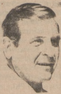
Kongr. Dan Rostenkowski

Zbliża się termin imprezy bankietowej. Znowu więc przekazujemy apel Komitetu, aby mający zamiar uczestniczyć w bankiecie nie zwlekali z nadsłaniem rezerwacji miejsc, lub życzenie w pamiętniku.