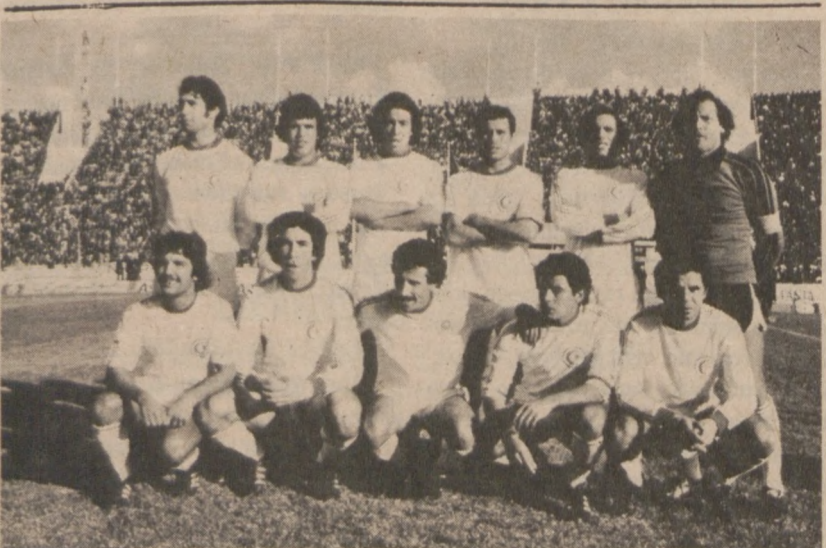
"MUNDIAL-78"—Reprezentacja Tunezji, która miała być dostarczycielem punktów, niespodziewanie w pierwszym meczu pokonała reprezentację Meksyku 3:1. W meczu z Polską przegrała 0:1, ale w końcówce miała przewagę.

● KUPIJCIE W SKŁADACH ● KTÓRE OGŁASZAJĄ SIĘ W DZIENNIKU ZWIĄZKOWYM