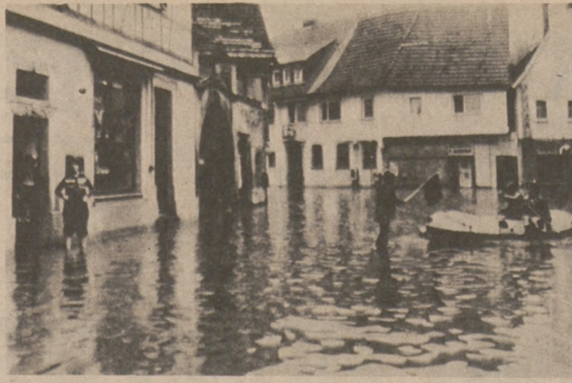
LAUFFEN, NIEMCY ZACHODNIE — Dzieci przebywają zalane wodą ulice na pontonach. Olbrzymie powodzie nawiedziły tę część Niemiec. Podobno nie pamięta się podobnych powodzi od 100 lat.

Szczeciński chór chłopięcy "Słowiki" zdobył główną nagrodę na europejskim festiwalu muzycznym młodzieży w Neopelt (Belgia). W imprezie uczestniczyło 91 zespołów z 27 krajów. Szczecińskie "Słowiki" zaproszono na tournée po NRF, Irlandii i Holandii.