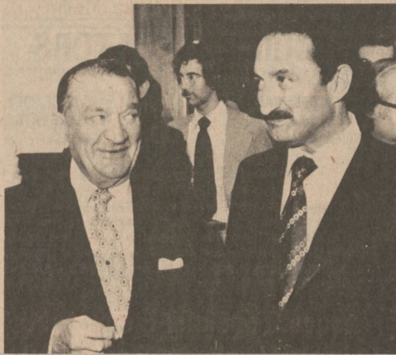
WASHINGTON — Premier rządu Turcji Bulent Ecevit (po prawej) spotkał się z kongresmanem Clementem Jerrym Zablockim, przewodniczącym Kongresowego Komitetu Spraw Zagranicznych. Spotkanie to miało miejsce na Kapitolu 2 czerwca.