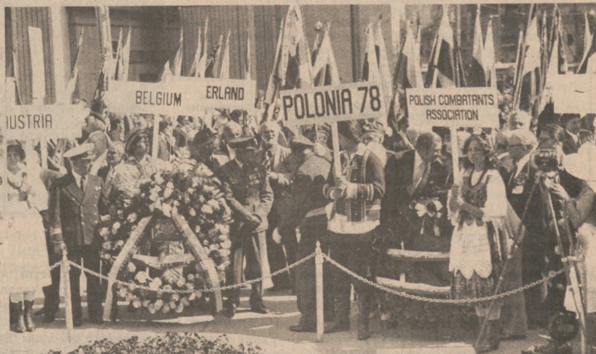
Zdjęcie przedstawia fragment ceremonii składania wieńców przed pomnikiem ku czci poległych żołnierzy, jaki znajduje się w Toronto przed gmachem starego ratusza.

"Polacy w Getcie Polskim Uduszą Sie... A Jeśli Rozpłyną Sie w Obcym Morzu — "Znikną"..."