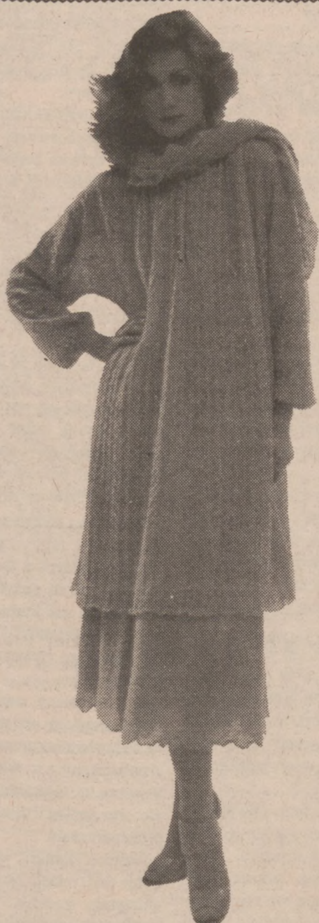
Włóczkowa narzuta nakładana na żorzetową sukienkę.