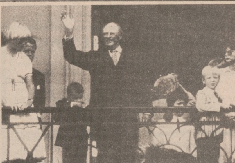
NORWEGIA. — Król Norwegii Olav V na balkonie swego pałacu w dniu urodzin. Król obchodził 75 rocznicę urodzin 2 lipca br. W tym samym dniu odbył się uroczysty obiad urodzinowy

Z danych obu departamentów wynika, że niemowlęta najczęściej umierają w szpitalach, ale już nie w tych samych, w których się urodziły. Większość danych z których korzystano pochodzi z 1975 roku. Przeciętnie stopień śmiertelności niemowląt urodzonych w Chicago wynosił 16,2 na 1,000 noworodków, kiedy w tym samym czasie w innych miastach wynosił on: w Los Angeles 9,6, w Nowym Yorku 13,7, w Detroit 15,7 a w Filadelfii 17,6.