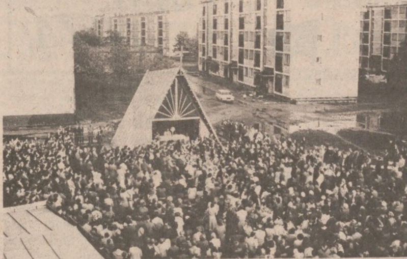
Msza św. na placu przed kapliczką w dniu 1 czerwca b.r.

Sprawdzą się powoli prorocze słowa biskupa Ignacego Tokarczuka wypowiedziane jesienią ub.r. w czasie uroczystości poświęcenia połowej kaplicy parafialnej na Osiedlu WSK w Rzeszowie. "Ta kaplica jest krzykiem rozpacz", wołał biskup. "Wybudowano ją, bo 25-tysięczna parafia, od 30-tu lat parafia bez kościoła, nie miała już innego wyjścia".