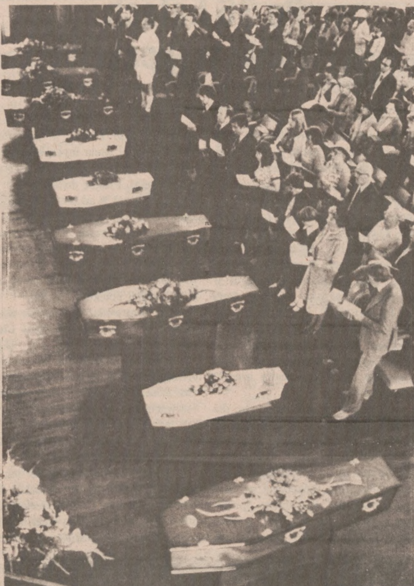
UMTALI, RODEZJA. — Zdjęcie to przedstawia zbiorowe ceremonie pogrzebowe jakie miały miejsce w Queens Hall 29 czerwca. Był to pogrzeb 12 misjonarzy zabitych przez bandy nacjonalistów rodezyjskich.