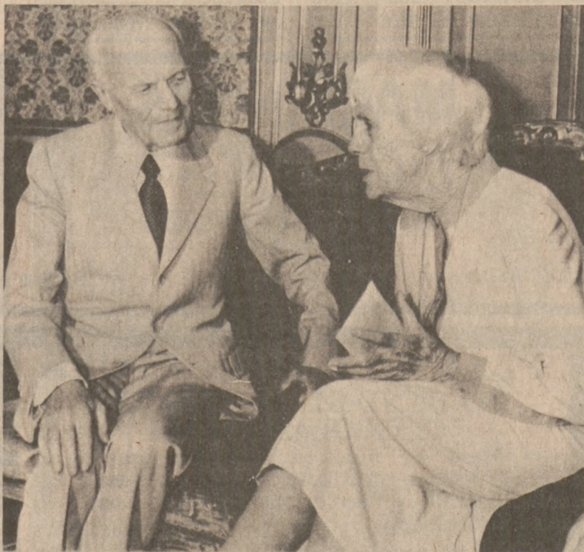
RZYM, Włochy — Lillian Carter, matka prezydenta Stanów Zjednoczonych, spotkała się tutaj z prezydentem Włoch, Sandro Pertini. Podczas wizyty w tym kraju wręczono jej medal Ceres wydany na jej cześć przez Organizację Żywności i Rolnictwa przy ONZ.

Plan realizacji projektu kształtuje się nastp.: 12 do 26 miesięcy przeznaczono na przejęcie terenu, dalszych 12 do 36 — na wyburzenie budynków i 12 do 36 — na ulokowanie dotychczasowych mieszkańców zburzonych budynków.