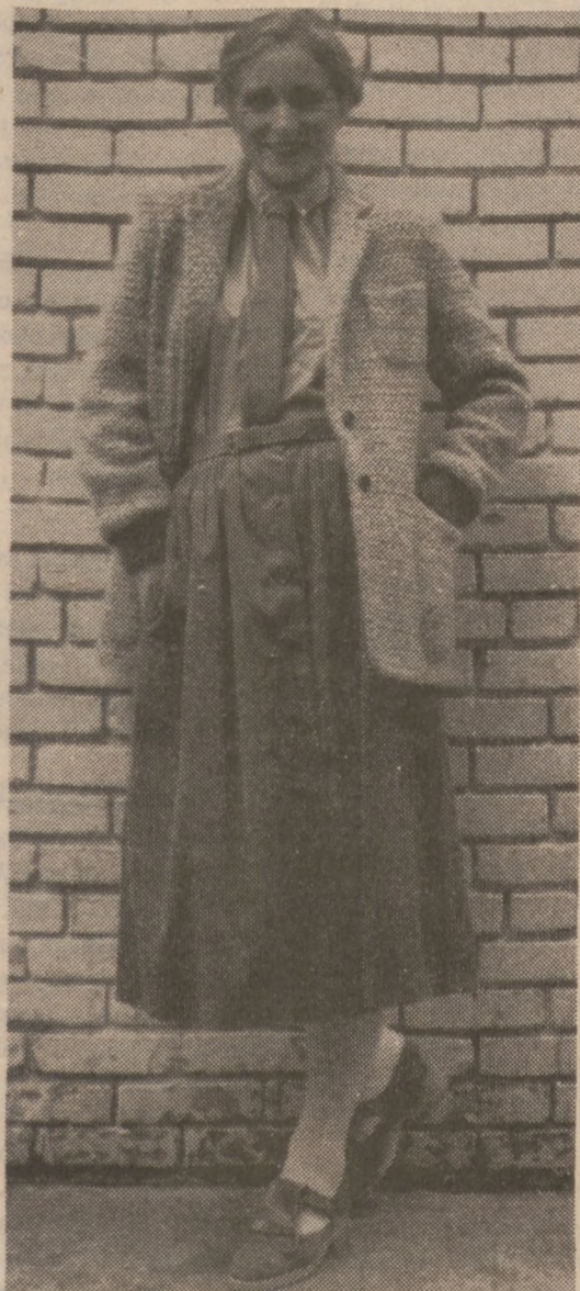
Jesienna kreacja z paryskiej kolekcji mody Daniela Hechtera.